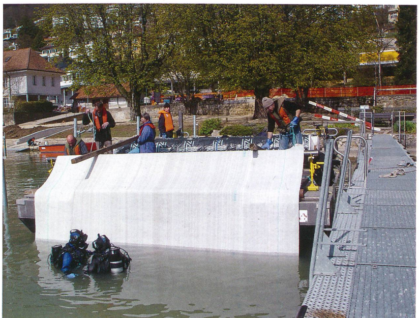
Abb. 6: Biel-Vingelz, Hafen. Schutz der jungsteinzeitlichen Siedlungsschichten im Hafenbereich durch die Verlegung von Geotextil.