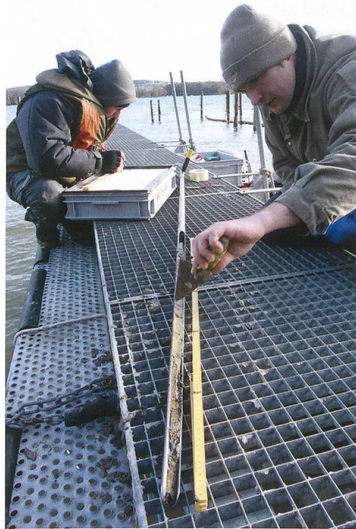
Abb. 5: Biel-Vingelz, Hafen. Wissenschaftliche Beschreibung und Dokumentation der Bohrkerne durch Jürgen Fischer und Marco Amstutz.

Josef Winiger, Bestandaufnahme der Bielerseestationen als Grundlage demographischer Theoriebildung. Ufersiedlungen am Bielersee 1. Bern 1989, 206–208.