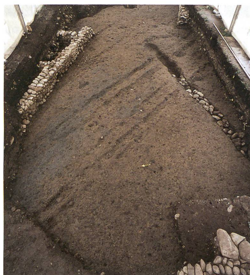
Abb. 3: Hasle bei Burgdorf, Kirchmatte. Die Karrenspuren der mittelalterlichen Landstrasse.

Unser archäologischer Befund lässt die Vermutung zu, dass diese untere Strasse möglicherweise wesentlich älter war. Wahrscheinlich führte diese Strasse, die sich heute nordöstlich von Hasle verzweigt und unter Umgehung des Dorfkerns direkt zur Brücke über die Emme geht, ursprünglich unmittelbar an der Kirche vorbei – der archäologisch erfasste Wegabschnitt – und verzweigte sich dort: ein Zweig führte weiter den Talrand entlang, während der zweite die Talhangkante erklimmte und über Eichholz in Richtung Süden zog. Wahrscheinlich ist die heutige Quartierstrasse Kirchmatte, eine Sackgasse, der letzte Rest dieses Strassenastes, der auf der Siegfriedkarte noch als durchgehender Feldweg zu erkennen ist (vgl. Abb. 2).