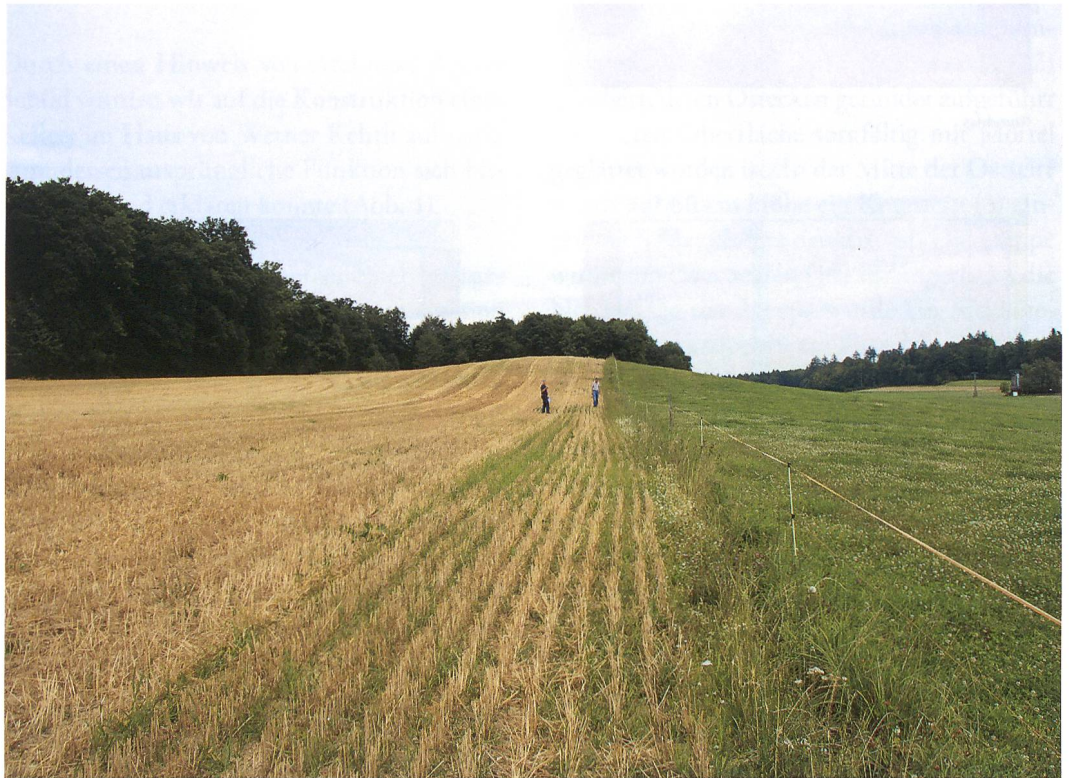
Abb. 1: Ins, Galge. Der «Galge» von Südwesten aus gesehen. Der markante Hügel diente als mittelalterli- cher Richtplatz.