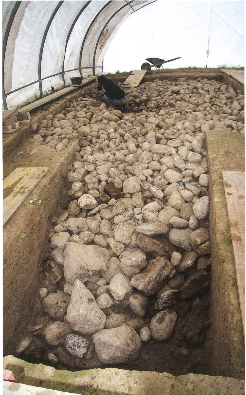
Abb. 5: Ins, Galge. Heinz Kellerberger arbeitet im Zentrum der gewaltigen Steinpackung. Im Vordergrund am Fuss des Hügels grosse Blöcke.

Die Untersuchungen belegen, dass wir hier ein grosses prähistorisches Monument fassen. Ob es sich um einen Grabhügel handelt oder ob eine Interpretation als Opferplatz oder Heiligtum treffender ist, ist anhand der Sondierungen nicht zu entscheiden. Möglich ist auch eine Kombination verschiedener Elemente. Gut 1,5 m der Hügelkuppe und damit auch die Reste des mittelalterlichen Galgens sind bereits dem Pflug zum Opfer gefallen, weitere 1,5 m des Steinkerns und der Erdüberdeckung sind aber noch unversehrt erhalten. Deshalb gilt es, sobald als möglich geeignete Schutzmassnahmen zu treffen, um diese aussergewöhnliche Stätte der weiteren Zerstörung zu entziehen.