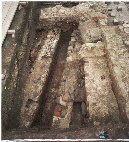
Abb. 8: Kallnach, Hinterfeld, römischer Gutshof. Der Kanal (264), ausgekleidet mit Terrazzomörtel und Hypokaustplatten. In den Kronen der Kanalwände Aussparungen für die Abdeckung. Das Podest im Vordergrund rechts könnte als Zugang zu (nicht nachgewiesenen) WC-Anlagen gedient haben, die über den angrenzenden Kanal gebaut waren. Im Hintergrund das praeefurnium (243) zu Raum 4. Blick nach Süden.

der piscina 1 aufgenommen haben. Wenig vor der Gebäudefront führte eine Traufrinne (345) das Dachwasser in den Kanal (264).