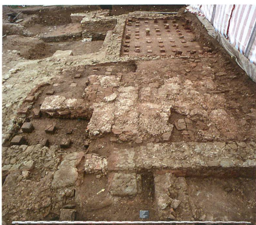
Abb. 6: Kallnach, Hinterfeld, römischer Gutshof. Blick von Osten über die Anlage. Im Vordergrund die Ostmauer (193) mit dem praefurnium zu Raum 4. Der Feuerkanal wurde sekundär eingebaut und nach Aufgabe des Hypokausts wieder zugemauert. In Raum 4 sind über dem verfüllten Hypokaust nur noch Spuren des eingezogenen Mörtelbodens erhalten.

In Raum 2, dessen Nordmauer dicht hinter der Grabungsgrenze folgen muss, gibt es keine Anzeichen verschiedener Bauphasen. Er könnte natürlich in verschiedenen Phasen der Thermenanlage unterschiedlich genutzt worden sein, als caldarium oder als tepidarium (lauwarmer Raum). Demgegenüber zeigte Raum 4 deutliche Funktionswechsel (Abb. 6). Das an seiner Ostwand erfasste praefurnium (243) wurde sekundär eingebaut. Offen bleibt, ob Raum 4 anfänglich nicht beheizt war, oder ob er ursprünglich von der Nordseite