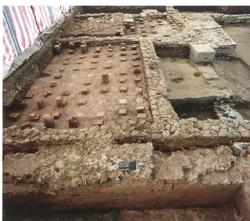
Abb. 5: Kallnach, Hinterfeld, römischer Gutshof. Im Vordergrund Raum 1. Der Unterboden des Hypokausts ist mit Dachziegeln belegt. Rechts die kleine Verbindungsöffnung zur Tubulatur zwischen den Mauern. An der Mauerfront Verputzreste mit Abdrücken von tubuli. Im Mittelgrund das caldarium Raum 2 und die porticus Raum 3 mit einer der beiden Säulenbasen. Im Hintergrund das frigidarium Raum 4 mit vorgebautem Erker. Blick nach Osten.

Das hypokaustierte Warmwasserbecken in Raum 1 ist ein Hinweis auf eine besonders luxuriöse Anlage, stand doch in kleineren Bädern das warme Wasser meist lediglich in einer Wanne zur Verfügung. Eine Besonderheit ist zudem die Hinterlüftung zwischen Gebäudemauern (169), (170) und Beckenmauer (180) durch die abschnittsweise Trennung mit tubuli (Hohlziegel) (Abb. 4). Diese waren durch eine Öffnung im untersten Bereich der Beckenmauer mit dem Hypokaust verbunden. Die Tubulatur an der Innenseite der Beckenmauer war nicht erhalten, liess sich aber anhand von Negativabdrücken im Verputz noch deutlich erkennen (Abb. 5).