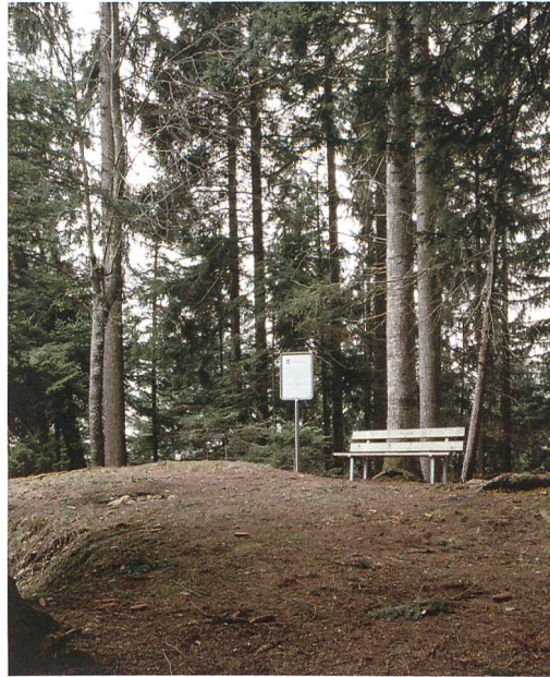
Abb.3: Langnau, Spitzenberg. Höchste Stelle des Burgplateaus, mit Informationstafel von 2004.

Dem Burghügel Fuss ist auf der Nordwestseite – rund 20 m tiefer als sein oberes Plateau – eine bewehrte, etwa 2500 qm grosse, sichelförmig bis nach Süden herumgeführte, ebene Terrasse mit leichtem Gefälle vorgelagert. (Abb. 5) Sie ist etwa 50 m lang, am Hügel Fuss fast 60 m breit und verschmälert sich am gegenüberliegenden Nordwestende auf 35 m Durchmesser. Auf der langen Westseite wird die Terrasse durch den natürlichen Steilhang, im Süden durch zwei (eventuell sogar drei) kurze, künstliche Quergräben (Abb. 6)