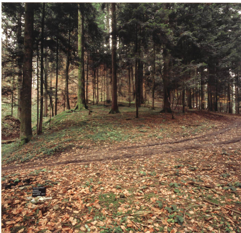
Abb. 5: Langnau, Spitzenberg. Westansicht des unteren Plateaus, mit künstlicher Hangkante zum Graben.