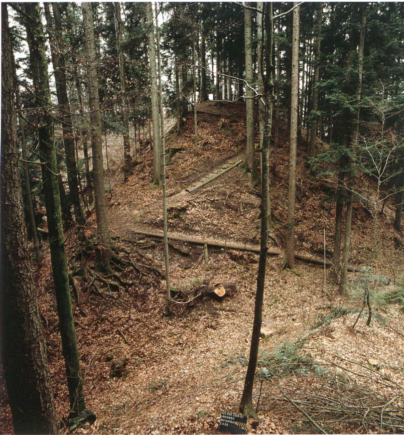
Abb. 1: Langnau, Spitzenberg. Nordwestansicht des Burghügels mit modernem Aufstieg.

Das ca. 400 qm grosse, langgestreckte Burgplateau hat eine Nord-Süd-Länge von 45 m und endet im Süden mit einem schmälern Halb- rund, im Norden mit einer breiteren Seite. Dabei besitzt es in der Höhe um einige Meter differierende Plateaustufen. Auf seinem etwas tiefer liegenden, 15 × 6–10 m grossen Nord-