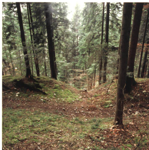
Abb. 6: Langnau, Spitzenberg. Quergraben vom unteren Plateau.

Die Terrasse könnte – analog zu anderen Burgstellen – als Vorburg gedient haben. Vielleicht waren hier Ökonomiegebäude der Burg oder ein bis zwei Höfe untergebracht, denn sie bot genügend Platz und war für Pferd und Wagen leicht zugänglich. Möglicherweise gab es hier im Mittelalter auch eine der Burg zugehörige kleine, bewehrte Siedlung, wie die heute noch existierenden Beispiele der Kombination von Burg und bewehrtem Städtchen, z. B. in Burgdorf, Kirchdorf, Kyburg und Laupen zeigen.