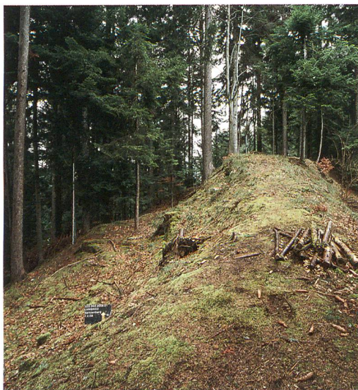
Abb. 2: Langnau, Spitzenberg. Burgplateau, Blick Richtung Norden.