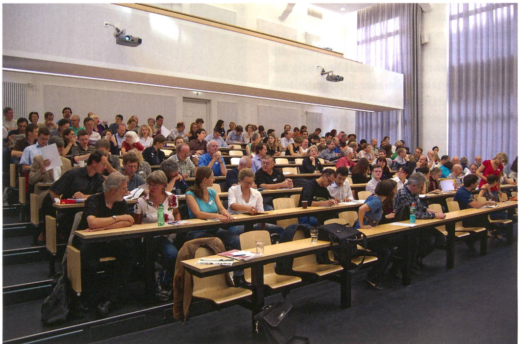
Abb. 1: Lenk, Schnidejoch. Internationales Symposium, Hörsaal A003 im UniS-Gebäude, Schanzeneckstrasse 1 der Universität Bern bot während eineinhalb Tagen ideale Bedingungen für Referenten und 140 Teilnehmer.