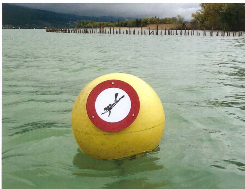
Abb. 3: Sutz-Lattrigen, Rütte. Zum Schutz der archäologischen Fundstelle musste zum ersten Mal in der Schweiz ein Tauchverbot aus denkmalpflegerischen Gründen erlassen werden.

Abb. 2: Sutz-Lattrigen, Rütte. Wind und Wellen erodieren vor allem bei starken Stürmen Teile der archäologischen Fundschichten.