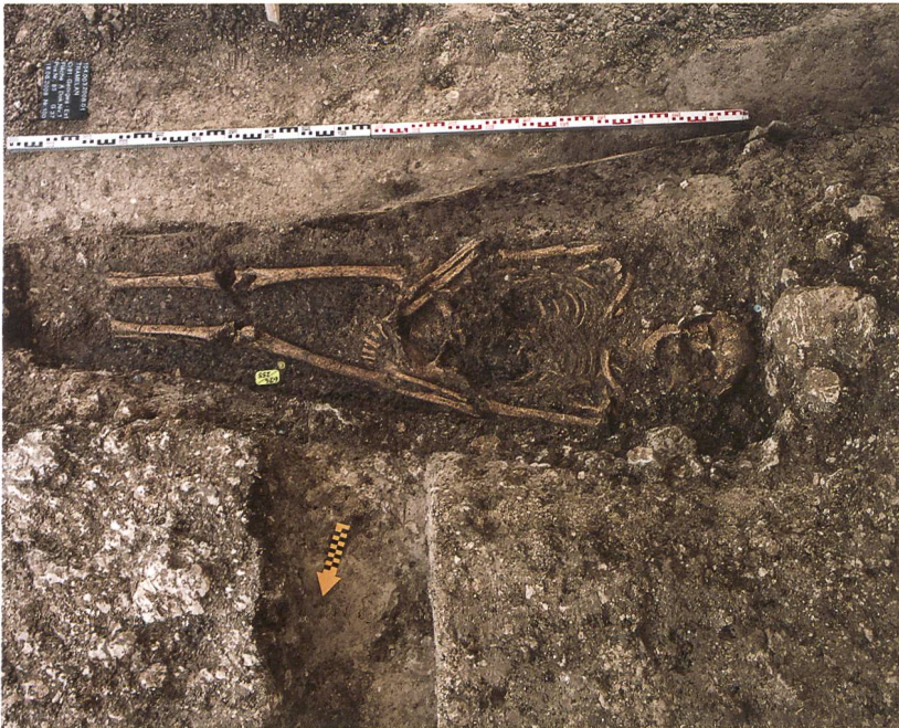
Fig. 3 : Tramelan, Crêt Georges Est. Les tombes orientées à l'est, perpendiculaires à la pente générale, sont minoritaires sur le site : ici la tombe T37.