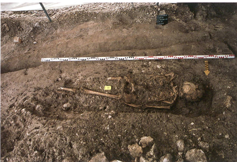
Fig. 4 : Tramelan, Crêt Georges Est. La tombe T38 représente une des sépultures orientées à l'est.

L'implantation des tombes T41 et T42 (fig. 5) semble intervenir au même moment : aucune perturbation n'a pu être identifiée, les squelettes se situent au même niveau et quelques pierres de calage apparaissent à la hauteur de la tête. Les deux inhumations rapprochées T35 et T36 (fig. 3) diffèrent par leur comblement et ne paraissent donc pas contemporaines. Toutefois, elles se respectent, ce qui sous-entend un marquage de surface, sans que l'on puisse déduire une chronologie relative entre elles. La sépulture T37 reposait sur une planche de fond en érable. Par ailleurs, on notera que trois des cinq sépultures nord-sud présentent un positionnement identique des bras : avant-bras gauche sur le bassin et bras droit le long du corps !