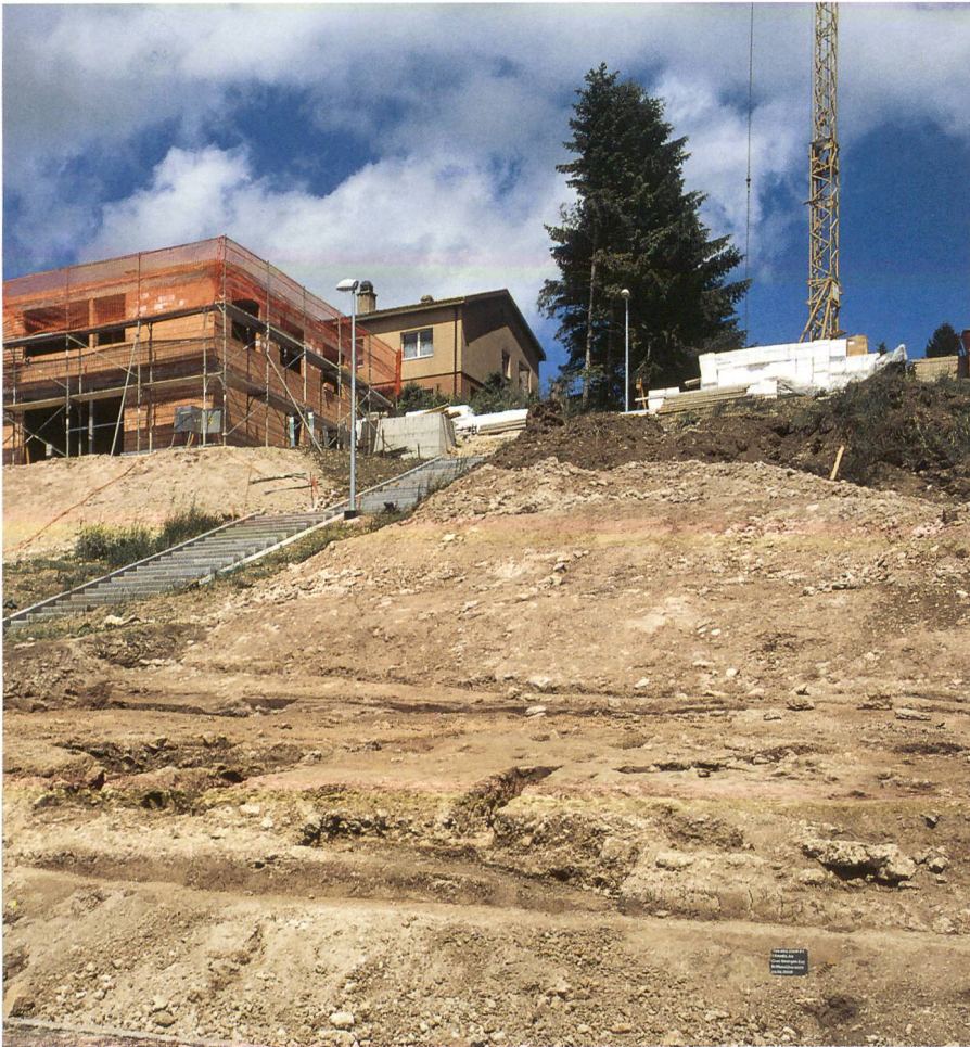
Fig. 1 : Tramelan, Crêt Georges Est. Vue générale du site après l'intervention du mois de juin 2008. On distingue les fosses sépulcrales creusées dans le terrain naturel en pente. Vue vers le nord-ouest.

Sur un coteau appelé le Crêt Georges, à l'entrée est du village de Tramelan, les vestiges d'une petite nécropole rurale du Haut Moyen Age sont apparus lors de creusages en 2006. Deux campagnes de fouilles s'y sont déroulées en 2006 et 2007 et ont fait l'objet d'un premier compte rendu dans ArchBE 2008. Les projets de construction de deux maisons familiales dans ce secteur ont conduit le Service archéologique à de nouvelles interventions en 2008 (fig. 1). Ces deux fouilles ont livré chacune cinq sépultures supplémentaires portant le total des tombes avérées à 40 et celui des squelettes à 41 (une tombe à inhumation double !). A cet ensemble s'ajoutent six structures majoritairement empierrées (T29, T43–T47), qui par leur forme et leur orientation sont à interpréter comme des vestiges funéraires, quoiqu'elles n'aient livré aucun ossement. Ces deux étapes permettent désormais de fixer la limite nord et probablement les extensions est et ouest de la nécropole (fig. 2).