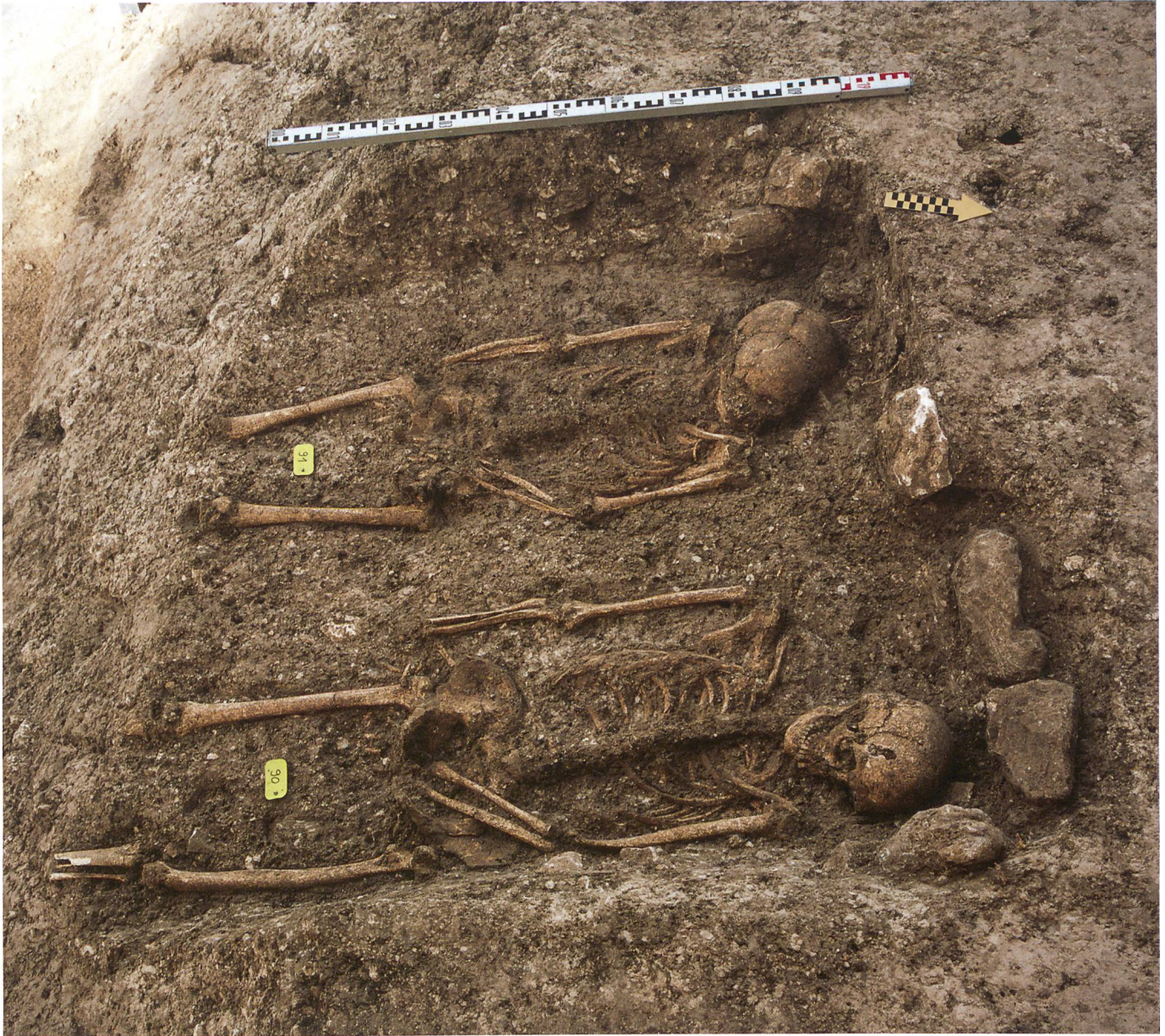
Fig. 5 : Tramelan, Crêt Georges Est : les deux tombes rapprochées T41 et T42 constituent un bel exemple de ces sépultures orientées nord-sud, majoritaires sur le site tramelot.