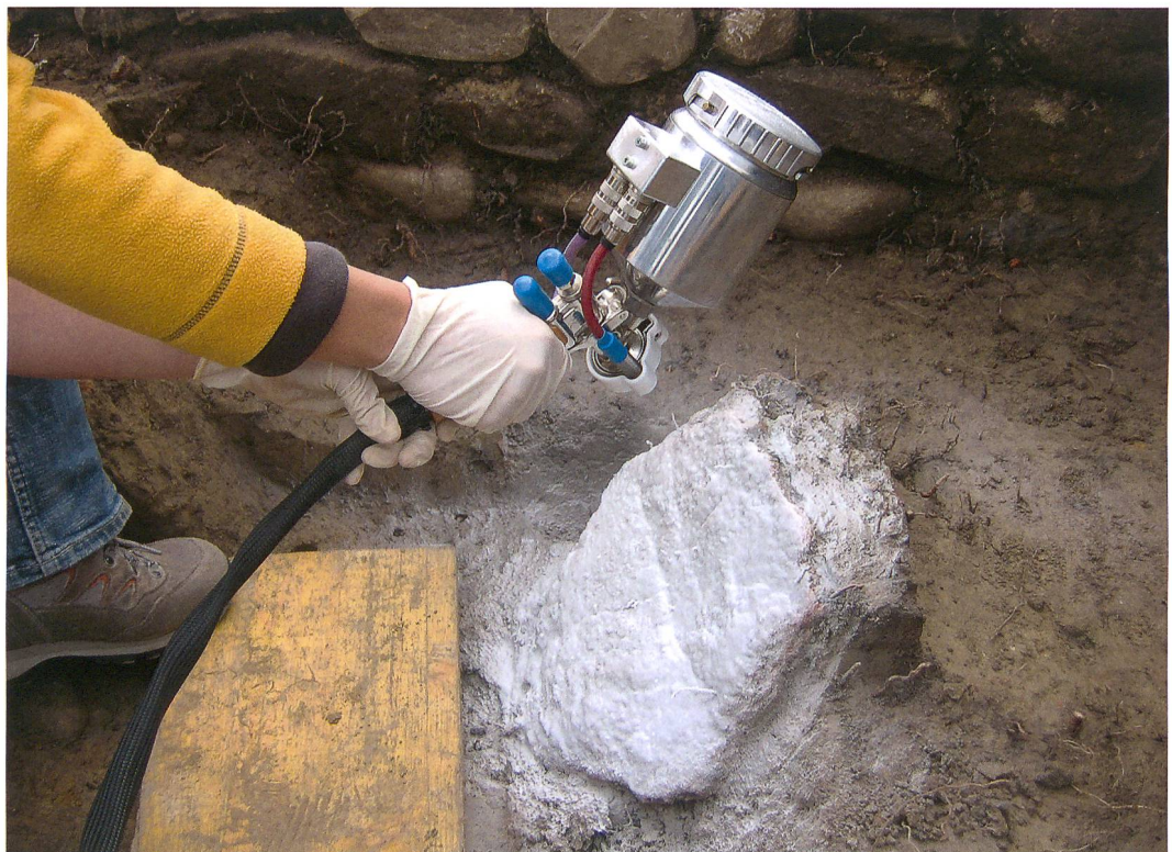
Abb. 1: Anwendung der CDAN-Schmelze mit der Sprühpistole auf Fragmente römischen Terrazzovertputzes in Jegenstorf, Solothurnstrasse.

Das CDAN stammt aus der Industrie und fand in der Mitte der 1990er-Jahre des 20. Jahrhunderts Eingang in die Konservierung und Restaurierung. Dies dank seiner Eigenschaft, sich bei Raumtemperatur nach einiger Zeit zu verflüchtigen. Dadurch bietet es sich zur temporären Festigung, zur Verstärkung und zum Schutz von Oberflächen an. Zusätzlich wird es als Trenn-, Füll- und Klebemittel verwendet. Nach und nach wurde das Produkt in den verschiedenen Spezialisierungsgebieten eingeführt und findet schlussendlich auch Verwendung in die archäologische Konservierung bzw. Restaurierung.