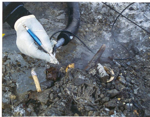
Fig. 3 : Dégagement d'artefacts à l'aide de l'aérographe projetant de fines gouttelettes d'eau chaude.

qui permet de séparer le bloc de son substrat. Un emballage adéquat et le retour rapide au laboratoire de restauration permettent de garder le mobilier à basses températures.