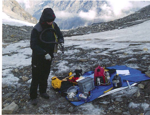
Fig. 2 : Préparation du matériel pour la fouille fine à l'aide de l'aérographe.

La fouille de la zone peut se développer en deux phases principales. Tout d'abord une phase de décapage qui consiste en un dégagement grossier de la zone. Ce dégagement peut se faire à l'aide d'un piolet, outil parfaitement adapté à ce type de tâche. Des ciseaux de sculpture sur glace permettent ensuite d'aplanir efficacement la zone de travail et, grâce à leur précision, de se rapprocher au plus près du mobilier (fig. 1). L'utilisation de ce ciseau est nouvelle sur les chantiers archéologiques en milieux gelés. Dans un deuxième temps, une phase de fouille fine a lieu. Un équipement spécifique a été développé afin de faire fondre localement la glace sans toucher les artefacts, tout en laissant une pellicule de glace superficielle afin de limiter les variations avec le milieu d'enfouissement (fig. 2). Cette autre méthode novatrice utilise un aérographe qui permet de vaporiser localement un jet d'eau chaude. De la neige et de la glace sont mises à chauffer avec un thermoplongeur dans une bouteille isotherme. Pour son fonctionnement le thermoplongeur est relié à un petit groupe électrogène portable. L'eau est chaude en une quinzaine de minutes et le bouchon muni du thermoplongeur est alors remplacé par celui muni du dispositif reliant l'aérographe et le compresseur. Après avoir vérifié que la température de l'eau projetée était d'environ 40°C à un bar, les artefacts sont dégagés (fig. 3). Ils sont soit prélevés directement ou sont levés en bloc à l'aide d'une scie-chaîne