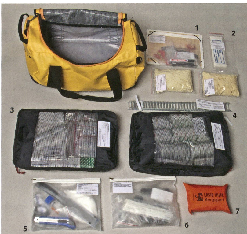
Fig. 1 : Equipement de conservation in situ préparé en vue d'une prochaine expédition. 1 Matériel de documentation. 2 Protection (masques et gants). 3 Divers outils. 4 et 5 Matériel d'emballage et de protection. 6 Eléments de fixation. 7 Trousse de premiers secours.

L'aspect du transport des artefacts est particulier en cela que le site Lenk, Schnidejoch est éloigné de plusieurs heures de marche du