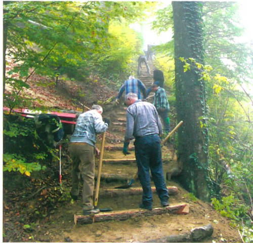
Abb. 3: Bellmund, Knebelburg. Die Rotarier im Einsatz im steilen Hang des Burghügels.

Unser herzlicher Dank für die gelungene Aktion geht an das Team des RCN mit seiner Verstärkung, an Hanspeter Luginbühl vom SFB und an die Gemeinde Bellmund.