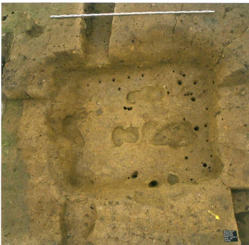
Abb. 7: Jegenstorf, Zuzwilstrasse, Webkeller 223. Hinten und rechts entlang der Kante Stickellöcher der Flechtwand. Rechts stand der Trittwebstuhl: Die Abdrücke der Beine des Webstuhls bilden ein Quadrat, darin liegt die Trittgrube. Blick nach Südwesten.

Eine Gruppe weiterer grosser Gruben lässt sich nicht eindeutig interpretieren. Es könnte sich um Grubenhäuser, Keller oder auch einfach um Materialentnahmegruben handeln. Einige der Gruben enthielten in der Einfüllung Keramik, die typologisch eher etwas jünger ist als die Glockenherstellung und der Webkeller. Sie belegen wohl eine weitere Siedlungsphase im 13./14. Jahrhundert. Andere können durch glasierte Keramik in Zusammenhang mit den neuzeitlichen Strukturen gebracht werden.