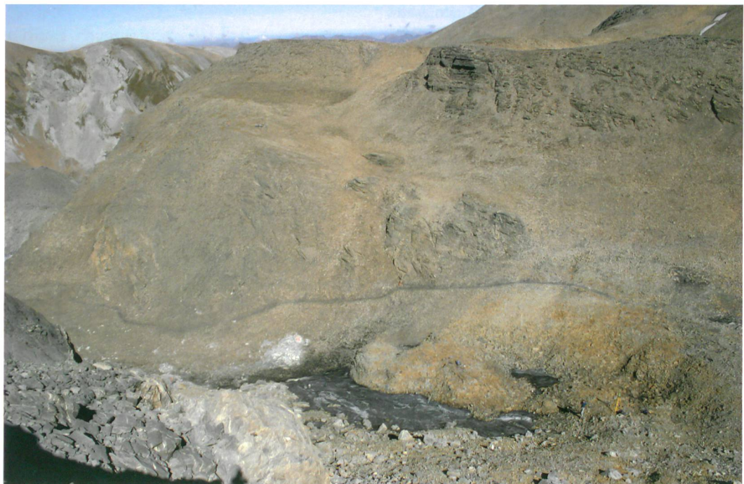
Abb. 1: Lenk, Schnidejoch. Die Fundstelle von oben. Übersicht nach NO. Unten rechts: Daniel von Rütte und Vermessungs-Stativ. In der Bildmitte: Fusspfad, der nach Süden (rechts) zur Passhöhe des Schnidejochs führt.

Die archäologischen Funde stammen aus einem kleinen Eisfeld an der Nordseite des Passes (Abb. 1). Das Gelände ist relativ flach und die Eismasse stagniert weitgehend. In den Jahren 2004 und 2005 schmolz das Eis massiv zurück und gab sehr viele Funde frei. Insgesamt wurden etwa 300 Objekte aus organischem Material, meist Holz oder Leder gefunden. Der starke Rückgang des Eises ist vermutlich auf den extrem warmen Sommer von 2003 zurückzuführen, der noch zwei Jahre nachwirkte. In den Jahren 2006 bis 2008 schmolz das Eis praktisch nicht mehr und es wurden nur noch