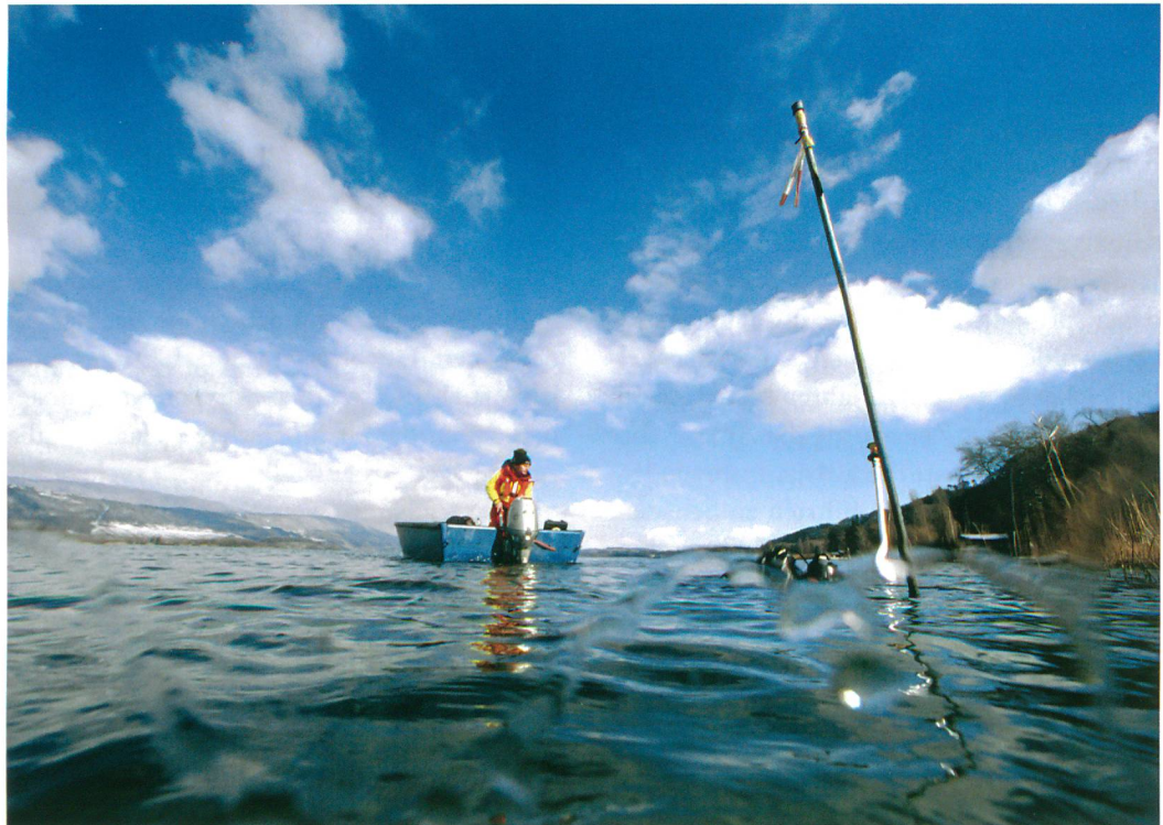
Abb. 1: Vinelz, Underi Budlei. Tauchaktion an der Fundstelle.