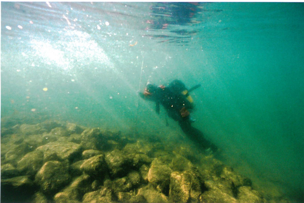
Abb. 3. Vinelz, Underi Budlei. Ansicht des Steindamms aus grossen Blöcken. Die Anlage wurde Ende des 19. Jahrhunderts errichtet.