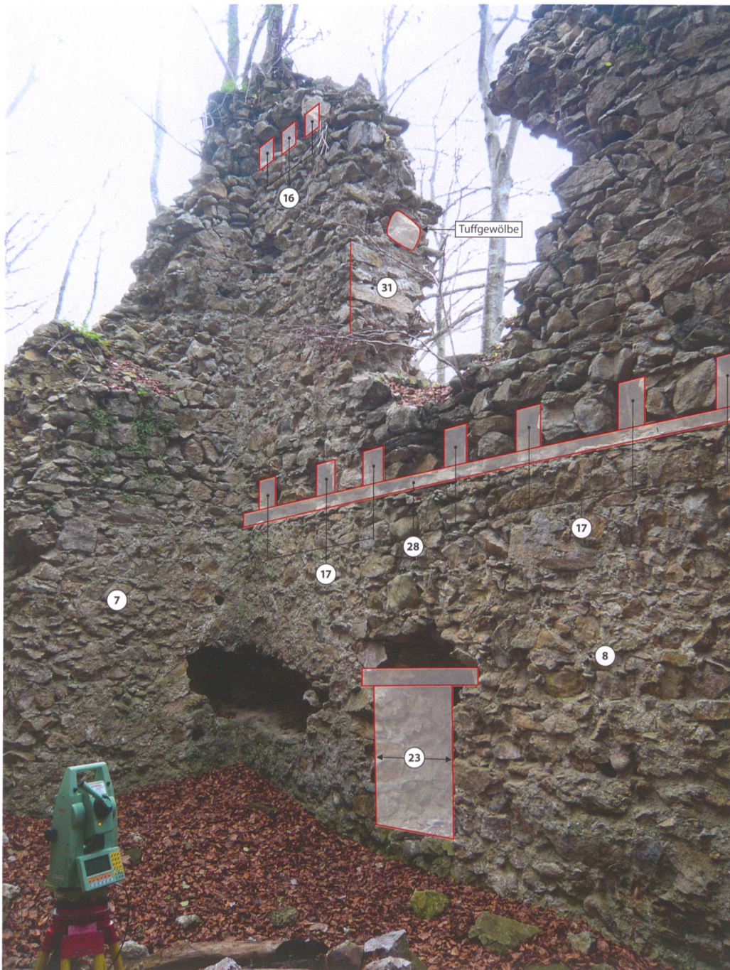
Abb. 1: Höfen, Burg Stocken, sogenannte Jagdburg. Nordwand und Nordwestecke innen.

dem wurden dendrochronologische Proben genommen. Der folgende Kurzbericht beschränkt sich auf den Wohnturm.