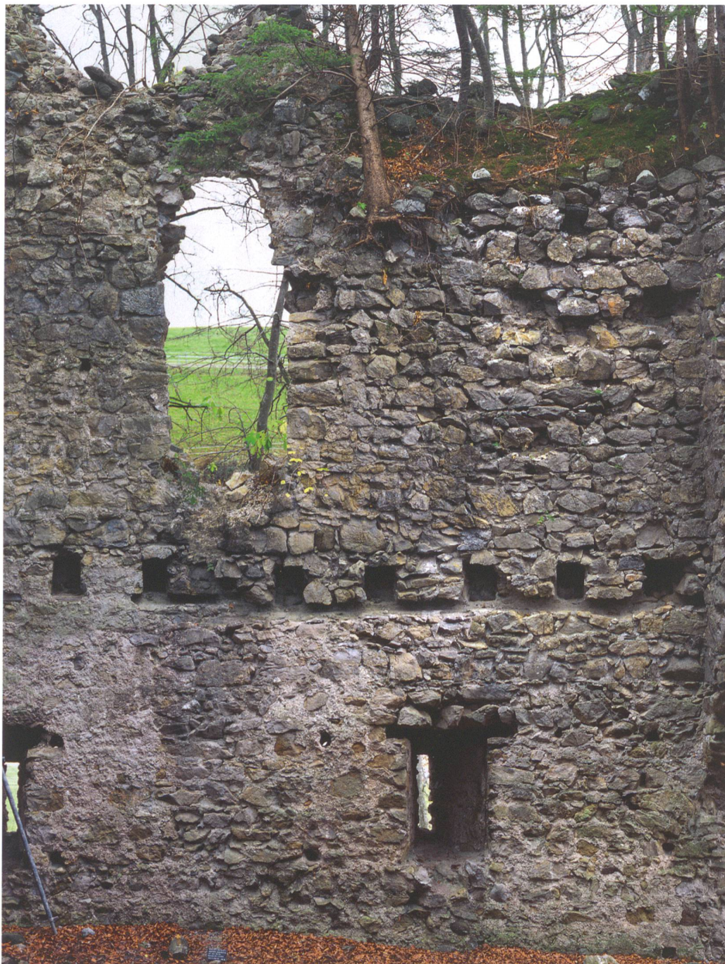
Abb. 2: Höfen, Burg Stocken, sogenannte Jagdburg. Südwand innen.

balken 19, 28 auf. In der Nordwestecke wies der Boden einst eine quadratische Öffnung auf, der entsprechende Wechsel in der Balkenlage ist als Balkennegativ 10 ablesbar. Es dürfte sich dabei um den Rahmen für einen Treppenschacht handeln; der entsprechende Abdruck 9 der ehemaligen Treppe, die gegen Süden nach unten führte, konnte denn auch an der Wand beobachtet werden. Der Vergleich mit anderen Burgen, etwa mit dem Restturm in Meiringen oder dem Schloss Köniz