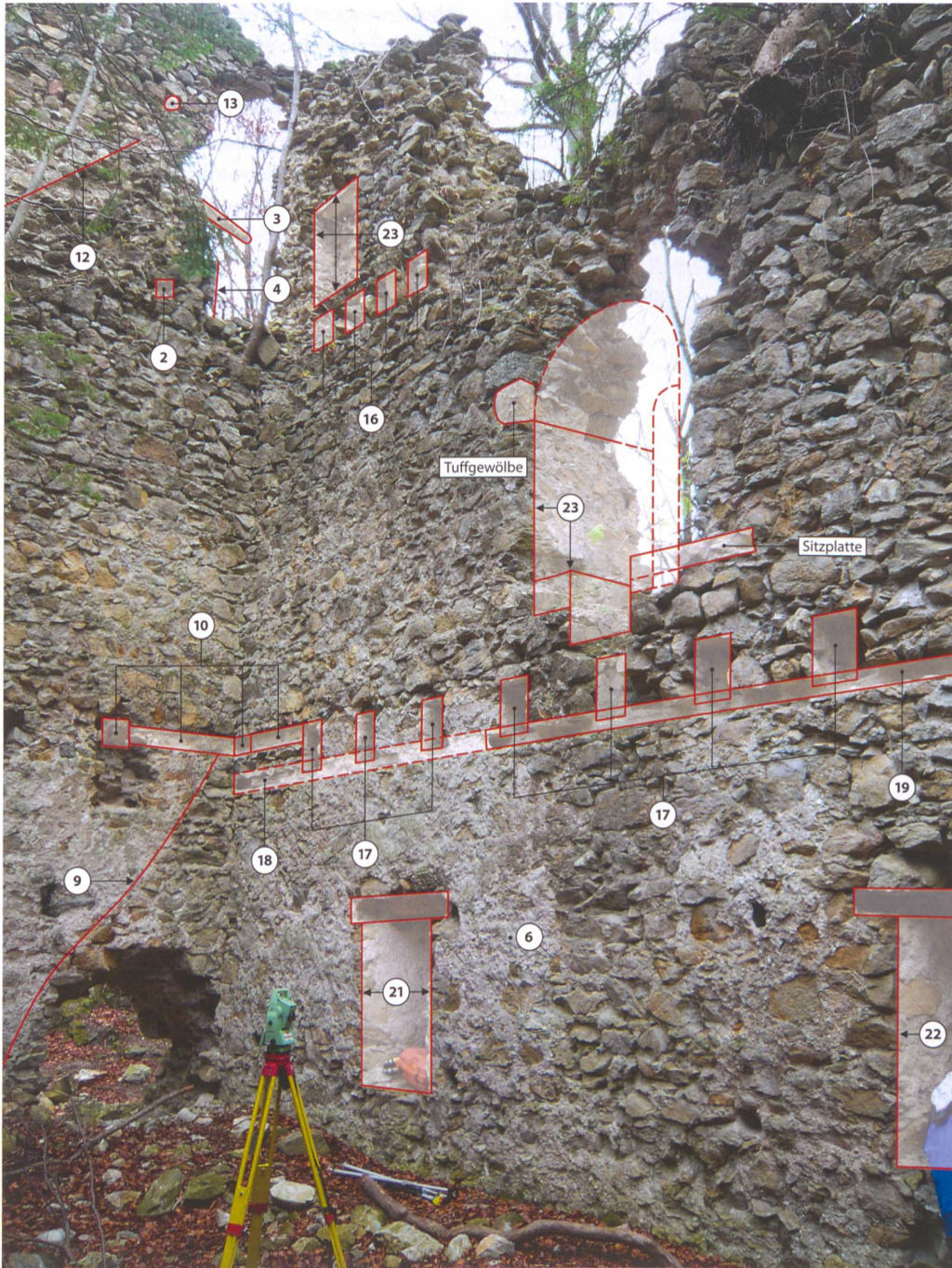
Abb. 3: Höfen, Burg Stocken, sogenannte Jagdburg. Süd- wand und Südostecke innen.

wände sowie die mutmassliche Sitzbank fragmentiert erhalten haben (Abb. 3). Vom westlichen Fenster 31 ist fast nichts mehr zu sehen, da sich an dieser Stelle nur ein grosser Mauer- ausbruch befindet. Immerhin gibt es einen Tuffblock im Mauerwerk, der wahrscheinlich den Ansatz des mutmasslichen Nischengewölbes bildete. In der gegenüberliegenden Nord- mauer hatte es eindeutig nur ein Fenster mit Sitznische 31; erhalten sind mehrere Tuffblö- cke des Nischengewölbes und noch ein Frag-