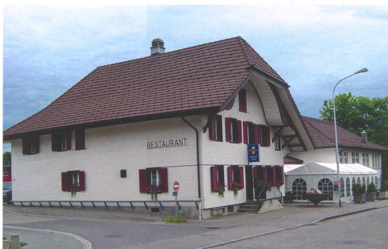
Abb. 1: Köniz-Niederwangen, Wangentalstrasse 46. Der ehemalige Gasthof Löwen (1716 bis 2010).

Der gewachsene Boden wird durch die eiszeitliche Moräne gebildet. Quer durch die Grabungsfläche verlief eine etwa 15 m breite