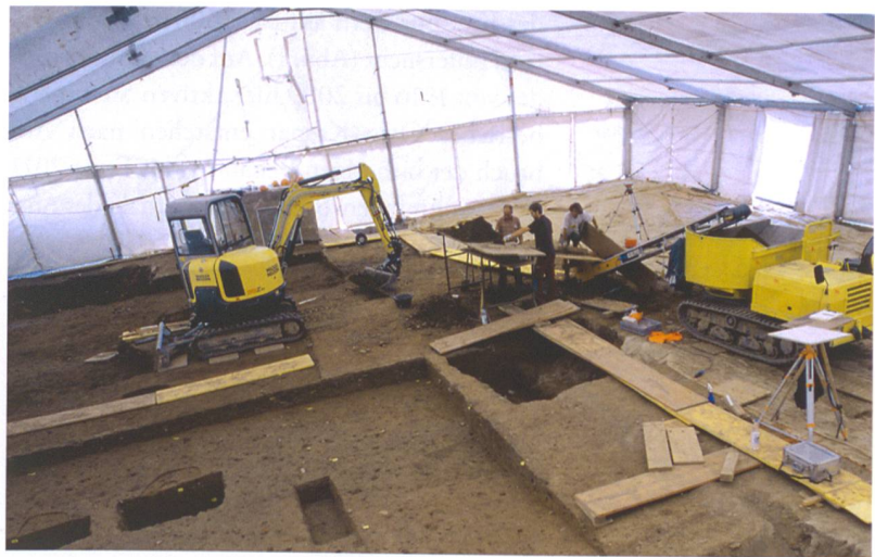
Abb. 3: Köniz-Niederwangen, Wangentalstrasse 46. Grabungsfläche mit Sortiertisch.