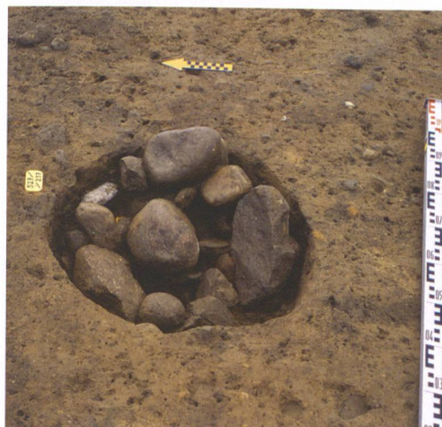
Abb. 4: Köniz-Niederwangen, Wangentalstrasse 46. Die mit Steinen gefüllte Grube 28 diente vielleicht als Unterlage für einen Schwellbalken oder Ständer eines Holzgebäudes.