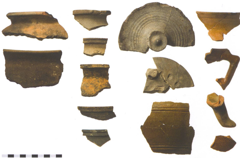
Abb. 2: Langenthal, Wuhrplatz. Ausgewählte Keramikfragmente des 12. bis 14. Jahrhunderts.

dert v. Chr. bis ins 10. Jahrhundert n. Chr. verfolgen. Historisch tritt Langenthal 861 n. Chr. gleich mit zwei schriftlichen Ortsnennungen in Erscheinung. Ein kontinuierlicher Niederschlag in den Schriftquellen erfolgt mehrheitlich erst ab dem 12. Jahrhundert und steht meistens in Zusammenhang mit dem Kloster St. Urban, welches dank einer Schenkung in Langenthal reich begütert war.