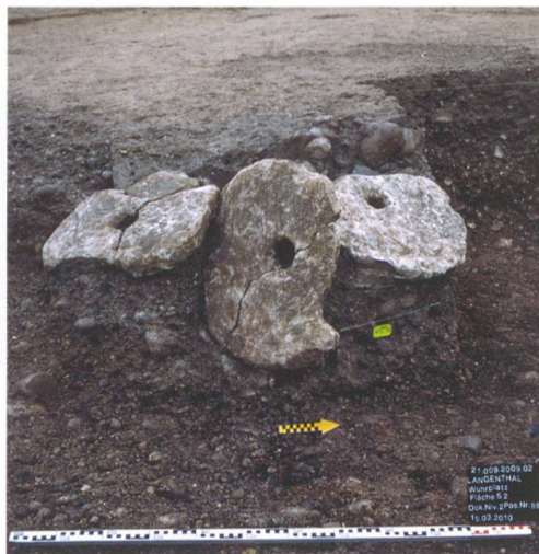
Abb. 5: Langenthal, Wuhrplatz. In einem alten Langenteam fand sich eine Konzentration von Mühlsteinen.

nicht ausgeschlossen werden und ist eine der zentralen Fragestellungen der nun folgenden Auswertung. Wasser wurde im Mittelalter vielfältig verwendet. Neben Trinkwasser war auch der Bedarf an Brauchwasser zum Reinigen von Produkten (Gerberei, Färberei) oder als Energiequelle (Mühlen) gross. Aber gerade die Lage an der Langete könnte diesem Siedlungsteil zum Verhängnis geworden sein, als infolge der Kleinen Eiszeit die klima-