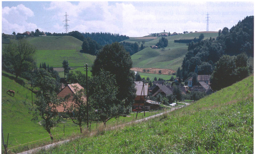
Abb. 1: Rüegsau, Dorf 128. Dorfkern von Norden: Die Fundstelle liegt links des Gasthofs Bären, der vor der Kirche (rechts im Bild) zu erkennen ist.

Am Fuss des Hangs unterhalb der nordseitigen Kirchhofmauer von Rüegsau wurden eine neue Garage und ein Gartensitzplatz angelegt (Abb. 2). Das Gefälle vom heutigen Kirchhof beziehungsweise ehemaligen Klosterareal hinunter zur Fundstelle ist gross, der steile