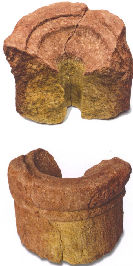
Abb. 7: Rüegsau, Dorf 128. Linke Spalte: Spolie aus gelbem Kalkstein, im oberen Bereich rot verbrannt. Aufsicht und Schnitt. M. 1: 4. Detail Palmetten M. 1:2.