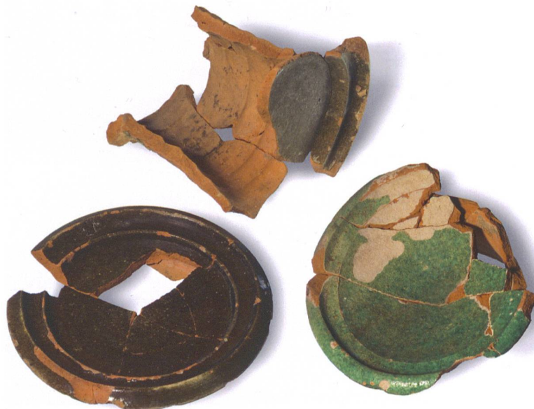
Abb. 6: Rüegsau, Dorf 128. Ofenkeramik aus der Überschüttung der Stützmauer. Einige der Tellerkacheln des 15. Jahrhunderts tragen eine weisse Grundengobe, andere sind nicht engobiert. M 1:3.

aber auch von verschiedenen Personen im gleichen Betrieb stammen. Es bleibt ebenfalls offen, ob sie ursprünglich alle im gleichen Ofen verbaut waren.