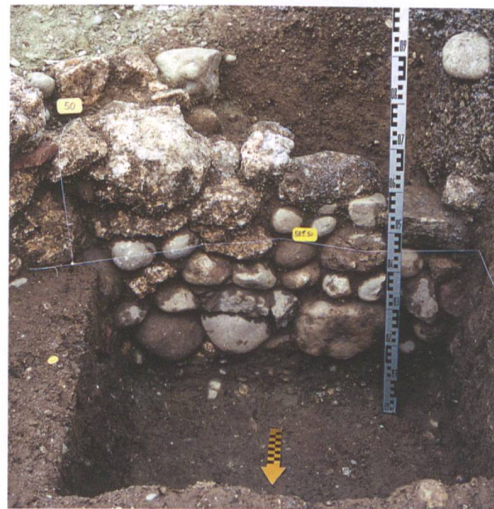
Abb. 3: Rüegsau, Dorf 128. Die Stützmauer war noch maximal sieben Steinlagen hoch erhalten.

Im Überdeckungsmaterial konnte ein kleines Ensemble von Tellerkacheln des 15. Jahrhunderts geborgen werden (Abb. 6). Einige davon weisen eine grüne Glasur über einer weissen Engobe auf, andere sind ohne Engobe glasiert. Die grundsätzlich sehr ähnlichen Kacheln stammen nicht alle von der gleichen Hand: Bei