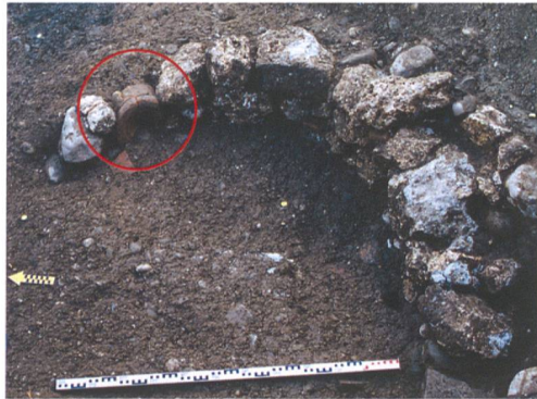
Abb. 4: Rüegsau, Dorf 128. Winkel der Stützmauer mit Spolien. Das Becken ist ganz links zu erkennen.