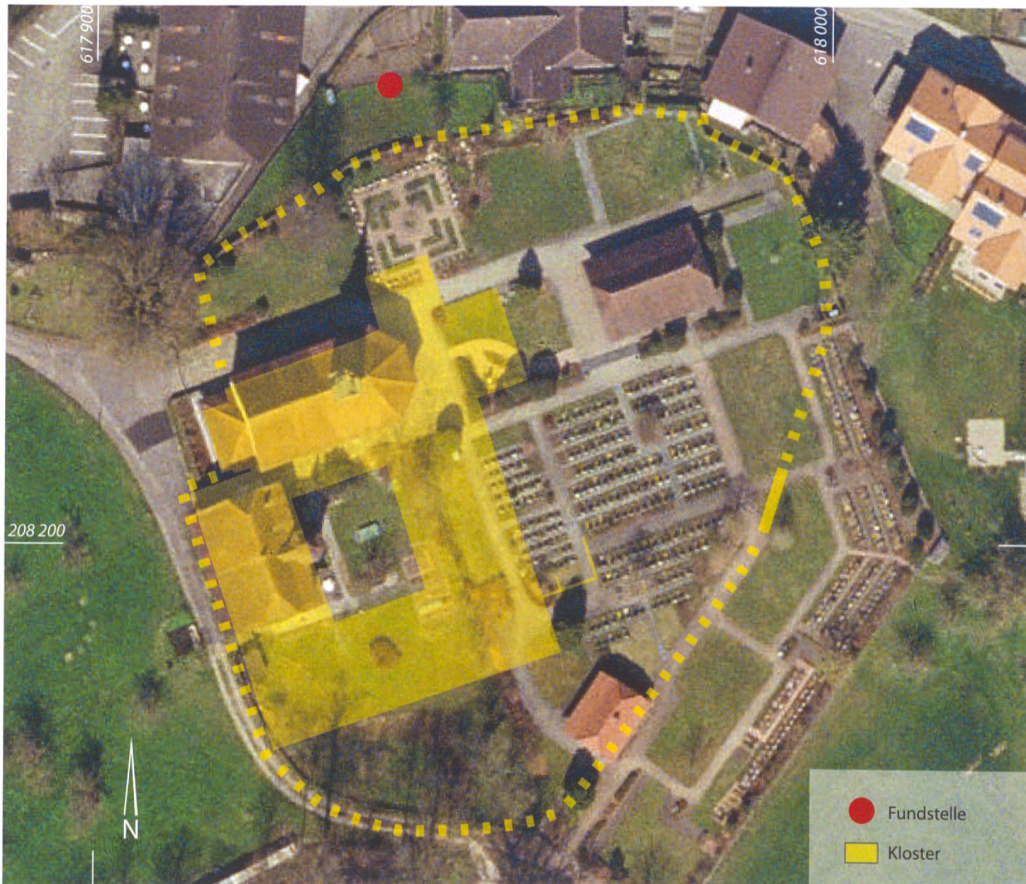
Abb. 2: Rüegsau, Dorf 128. Plan der Klosteranlage und Lage der Fundstelle. M. 1:1000.

Hang entsprechend rutschgefährdet. Deshalb erstaunt es nicht weiter, dass anlässlich des archäologisch begleiteten Aushubs am Hangfuss Teile einer Stützmauer freigelegt werden konnten. Sie war trocken gemauert und noch bis zu sieben Steinlagen hoch erhalten (Abb. 3). Als Baumaterial dienten Geröllsteine, kristalline Bruchsteine und wiederverwendete Tuffsteinblöcke, an denen zum Teil noch Mörtel haftete (Abb. 4 und 5). Die Hinterfüllung und das später vom Hang her über die Mauer abgerutschte Material liessen sich kaum unterscheiden, es handelt sich wahrscheinlich um das gleiche Sediment. Vermutlich war die verhältnismässig kleine und einfach gebaute Stützmauer ihrer Aufgabe nicht sehr lange gewachsen.