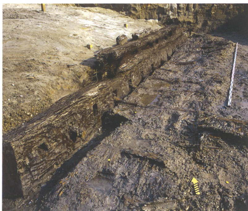
Abb. 5: Studen, Wydenpark. Eichenbalken am äusseren Dammfuss. In Zapfenlöcher sind Stangen eingelassen, die als Skelett eines Rutengeflechts dienen. Über dem Rutengeflecht setzte die Dammaufschüttung an. Eine zweite Balkenlage, wie sie dieses Bild zeigt, war nur vereinzelt erhalten. Blick nach Norden.

Gegen den Nordwestrand der Grabungsfläche stieg der anstehende Kies bis unter die Humusdecke hoch. Auf dieser natürlichen Kiesbank dürfte in römischer Zeit ein Gebäude gestanden haben. Eine kleine Schutthalde, einige Pfostenlöcher und ein Sodbrunnen waren jedoch alles, was sich davon erhalten hatte (Abb. 3). Ausserdem konnte ein Säuglingsknochen geborgen werden.