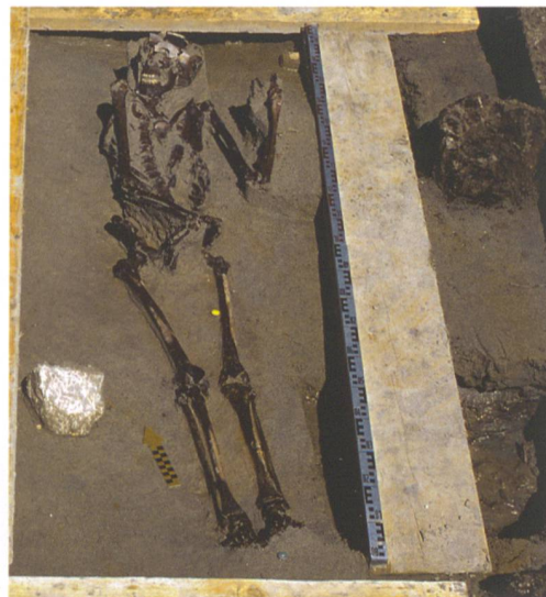
Abb. 9: Studen, Wydenpark. Grab 383 lag praktisch im Strassengraben. Rechts Pfostenreihe und Balken des Dammfusses. Blick nach Norden.

Uferverbauung reichte bis in die Sohle des Aarebets hinunter. Dank dieser Verbauung konnte direkt vor der Dammfront ein steiler Abfall des Ufers gesichert werden – eine Voraussetzung, um mit Schiffen anlegen zu können und den Damm als Mole zu benutzen.