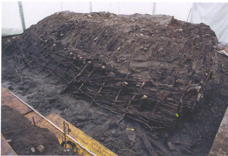
Abb. 6: Studen, Wydenpark. Die flussseitige Uferböschung nach Entfernen des Steinmantels. Die Dammfront wird durch eine Pfahlreihe gebildet. Davor der Ansatz der mit Rutengeflecht gesicherten Uferböschung. Blick nach Norden.

Die flussseitige Dammfront wurde von einer Reihe kleiner Pfähle gebildet. Über dem Kern folgte eine Kies- und Bruchsteinaufschüttung, die durch eine Armierung aus mehreren Lagen von Rutengeflechten verstärkt war (Abb. 6). Die Geflechte setzten über der Pfahlreihe, an der sie verankert waren, an und gaben mit ihrer Neigung den Böschungswinkel des vor der Dammfront folgenden Flussbetts vor. Als Mantel folgte über der obersten Rutenlage eine Schüttung aus Bruchsteinen. Diese