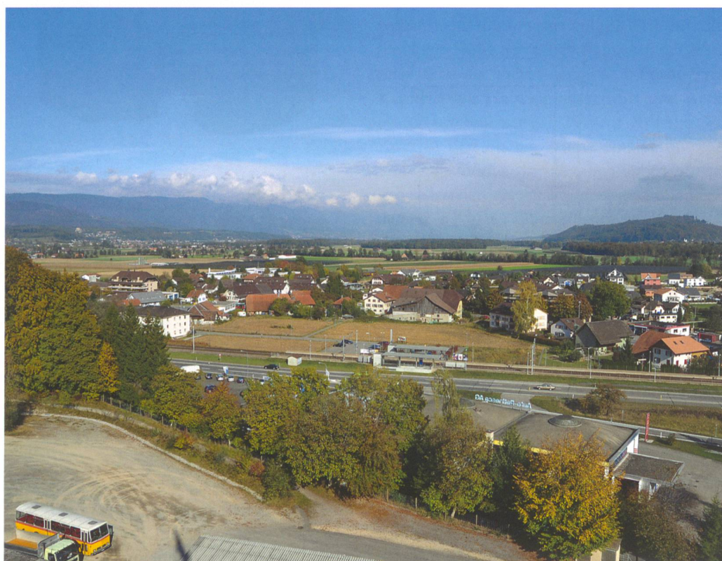
Abb. 1: Studen, Wydenpark. Blick vom Turm der Kieswerk Petinesca AG auf die Fundstelle (Bildmitte). Das Grabungsareal umfasst die Freifläche nordöstlich der Zufahrt zur Bahnhaltestelle und den auf dem Bild noch durch sechs angrenzende Altbauten belegten Raum. Ein ähnlicher Blickwinkel bot sich den Bewohnern des römischen Petinesca von den Hängen des Vicus aus. Blick nach Nordosten.