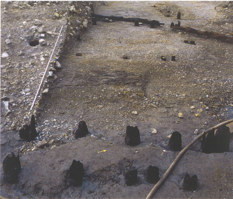
Abb. 8: Studen, Wydenpark. Blick «von der Brücke» Richtung Land. Im Vordergrund die Pfähle des ersten Jochs. Dahinter im Planum Reste von Rutengeflecht sowie Hölzer des Widerlagers und der Dammverankerung. Links die unter der Brücke gelegene Uferböschung und das geschnittene Widerlager. Blick nach Westen.