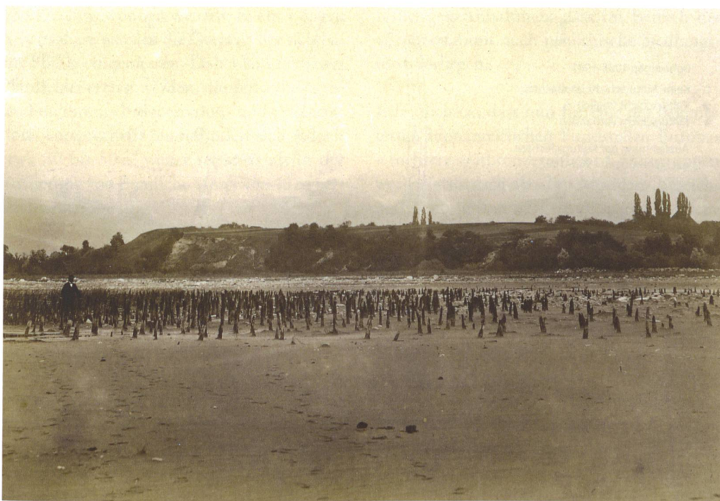
Abb. 9: Mörigen. Berühmtes Bild der freiliegenden Siedlungsreste von Mörigen. Mit der Ersten Juragewässerkorrektur wurde der Seespiegel des Bielersees um etwa 2 m abgesenkt. Dieser massive Eingriff sorgt heute für Schäden durch die Erosion der Flachwasserzone.