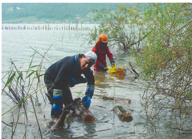
Abb. 3: Sutz-Lattrigen, Rütte. Aufräumaktion in der endneolithischen Fundstelle durch die Tauchequipe. Treibholz und umgestürzte Bäume reissen Furchen in die Kulturschichten und beschleunigen die Erosion.

normalerweise die systematische Erfassung, Beobachtung oder Überwachung eines Vorgangs oder Prozesses mit Hilfe von technischen Hilfsmitteln oder Systemen verstanden. Zentrales Element ist dabei eine periodische Durchführung, um anhand von Datenvergleichen Schlussfolgerungen ziehen zu können. 2006 veröffentlichte der niederländische «National Service for Archaeology, Cultural Landscape and Built Heritage» ein Handbuch mit dem Titel «Archaeological Monitoring Standard. Guidelines for the non-destructive record-