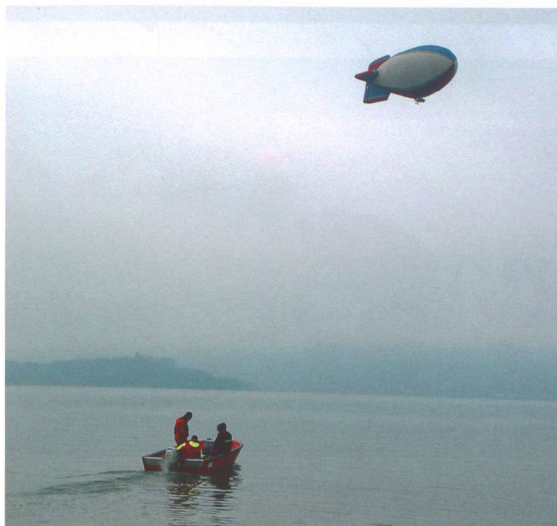
Abb. 1: Bielersee. Fabien Droz aus Thielle NE bietet Fahrten in seinem steuerbaren Heissluftballon HB-QSJ vom Typ Thunder & Colt AS-105 MK II an. Der 34 m lange zeppelinartige Ballon wird von einem Propeller angetrieben und gleitet gemächlich mit maximal 37 km/h dahin. Der grosse Vorteil für die Beobachtung von archäologischen Fundstellen in der Flachwasserzone ist die geringe Flughöhe: Der Ballon kann bis auf 30 m heruntergehen und sogar auf der Stelle stehen bleiben. Testflug der Tauchequipe im Januar 2010.

Das Bewusstsein, archäologische Fundstellen in situ zu konservieren, wurde durch das nun seit 15 Jahren bestehende Übereinkommen merklich gesteigert. Im gleichen Zeitraum tauchte auch der Begriff «Monitoring» in der Terminologie der archäologischen Denkmalspflege erstmals auf. Unter diesem Begriff wird