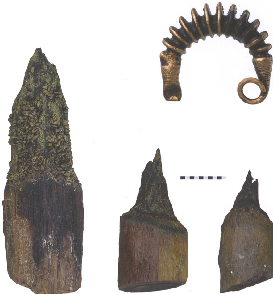
Abb. 11: Mörigen, Steinstation und Bronzestation. Oberflächenfund einer spätbronzezeitlichen Raupenfibel. M. 1:1.

Erfreulich ist, dass nun für eine der bekanntesten bronzezeitlichen Fundstellen Europas – mehrere spätbronzezeitliche Gerätegruppen werden stilistisch als «Typ Mörigen» bezeichnet – zum ersten Mal dendrochronologische Daten vorgelegt werden können. Im Hinblick auf das wissenschaftliche Potential der Fundstellen ist es hingegen äusserst alarmierend, dass die beprobten Eichenpfähle zu einem Teil bereits bis in den Spitzenbereich erodiert sind (Abb. 12). Wenn diese Situation gesamthaft eintritt, können die Pfähle nicht mehr jahrgenau datiert werden, weil die Waldkante, das heisst der äusserste Jahrring damit verloren geht. Um weitere Anhaltspunkte zu den Erosionsvorgängen in der Fundstelle zu bekommen, wurden zahlreiche Erosionsmarker gesetzt.