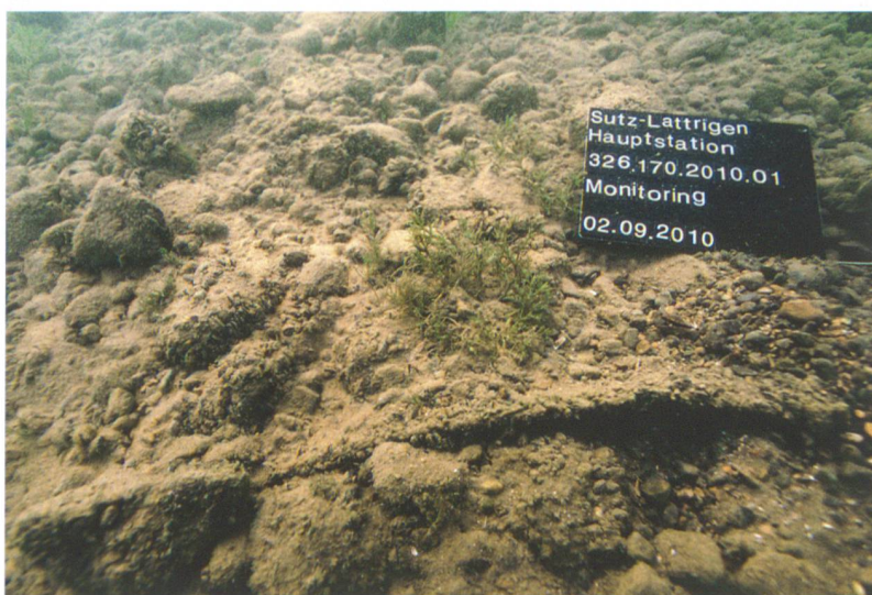
Abb. 8: Sutz-Lattrigen, Hauptstation, Innen. Detail des Seegrunds im Bereich der 2003 und 2004 verlegten schweren Geotextilmatten. Im Bild ist vorne eine freiliegende Kante zu erkennen, insgesamt ist der künstlich geschaffene Seegrund bereits nach wenigen Jahren aber kaum mehr von einem natürlichen Seegrund zu unterscheiden.

Auch in Sutz-Lattrigen, Hauptstation Innen zeigte die Kontrolle im Herbst 2010, dass die eingebrachte Kiesauflage flächig über den 2003 und 2004 verlegten schweren Geotextilmatten liegt (Abb. 8). Der künstliche Seegrund ist von vielen Muscheln und Pflanzen bewachsen und sieht erstaunlich natürlich aus. Die Lage der Matten ist kaum zu lokalisieren, da sie vollständig mit dem Kies überdeckt sind. Auch hier ist die Lage der Geotextilien als optimal zu bezeichnen. Insgesamt gesehen sind die Schutzmassnahmen in Sutz-Lattrigen, Hauptstation, Innen komplexer, da sie sich in einer deutlich geringeren Wassertiefe befinden als die Massnahmen in der äusseren Hauptstation. Die Kraft der Wellen ist im flachen Uferbereich natürlich besonders intensiv, und die Gefahr, dass der Kies anfängt zu «wandern», bedeutet hier ein grösseres Risiko.