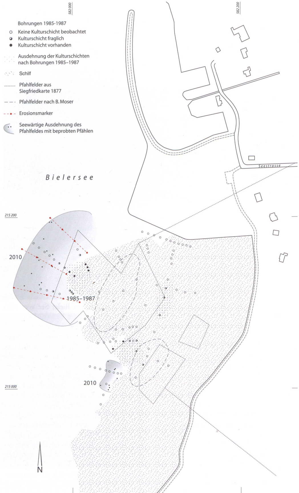
Abb. 10: Mörigen, Steinstation und Bronzestation. Situation der Fundstellen mit Bohrsondierungen, Ausdehnung von Kulturschichten und Pfahlfeld und Erosionsmarkern. M. 1:2500.