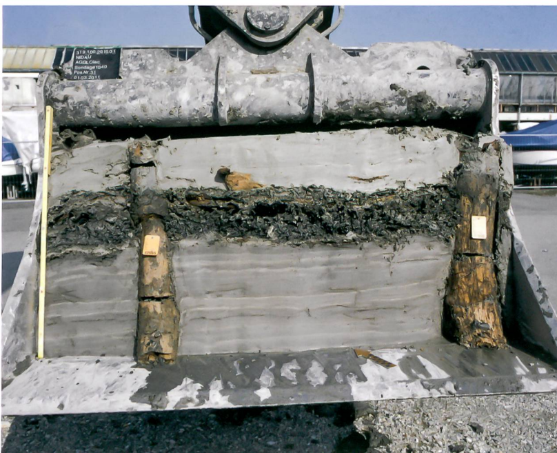
Abb. 2: Nidau, Strandboden. Sondierung 1040. Fundschicht und Pfähle.

Im Zusammenhang mit der Machbarkeitsstudie der Gemeinde Nidau und Biel musste der ADB eine Expertise zu Umfang, Kosten und Durchführbarkeit von archäologischen Rettungsgrabungen abgeben. Diese beruhte auf den bis dahin vorliegenden Grundlagen. Mit der weiteren Konkretisierung des Projekts «AGGLOlac» zeigte sich, dass diese für eine Beurteilung der Konsequenzen im Hinblick auf im Boden vermutete Kulturgüter nicht ausreichten. Zwischen November 2010 und Mai 2011 wurden deshalb 58 Bagger Sondierungen und acht Bohrsondierungen durchgeführt. Frühere Bohrungen gingen bis in die damals als genügend erachtete Tiefe von 4 m, aber bereits die Sondierungen für die EXPO.02 legten nahe, dass dies zu wenig tief war. Deshalb wurde die Sondierentiefe während der Arbeiten von 2010/11 auf 5 bis 6 m erweitert. Die Bagger Sondierungen erwiesen sich im Verlauf der Arbeiten als erfolgreiche Vorgehensweise, die deutlich bessere Einblicke in die Sedimente gewähren als Bohrsondierungen. Aufgrund der instabilen Terrainverhältnisse verliefen die Arbeiten im Grenzbereich des gerade noch Möglichen, einige Sondierungen mussten wegen der Gefährdung der beteiligten Mitarbeiter abgebrochen werden. An einzelnen Stellen wurde aufgrund von Befürchtungen, dass Gebäude oder Installationen Schaden nehmen könnten, ganz auf Sondierungen verzichtet. Letztlich waren die Bagger Sondierungen deutlich aufwendiger als