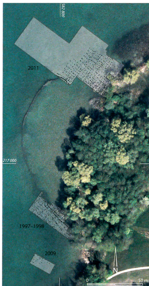
Abb. 1: Sutz-Lattrigen, Rütte. Pfahlfelder der Rettungsgrabungen 1997/98, 2009 und 2011. Sie repräsentieren mehrere Dorfanlagen aus der Zeit um 2700 v. Chr.

Bei dieser verlockenden Aussicht ist es kein Zufall, dass die ersten Sondierungen des Bielerseeprojekts – genau 100 Jahre nach von Fellenberg – im Winter 1984 unter der Leitung von Joseph Winiger in Sutz-Lattrigen, Rütte, starteten (Abb. 2). 1997/98 führte der Archäologische Dienst des Kantons Bern erste Rettungsgrabungen durch, um provisorische Schutzmassnahmen für die Fundstelle zu realisieren (Abb. 1 und 2). Die Erosion der archäologischen Fundschichten in der Station