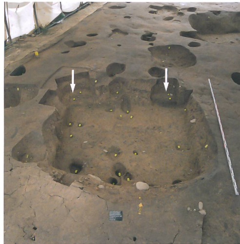
Abb. 2: Bätterkinden, Bahnhofstrasse 3. Quadratisches Grubenhaus (Seitenlänge 3,3\text{ m} , Tiefe 0,7\text{ m} ). In der Grubensohle sind Pfosten- und Stake-tlöcher erhalten. Im Hintergrund schneiden zwei Pfosten das Grubenhaus (Pfeile); sie gehören zum Gebäude der Phase 2. Blick nach Norden.

Die archäologische Grabung gibt nur einen unvollständigen Eindruck dieser ländlichen Siedlung, die, möglicherweise mit zeitweiligen Unterbrüchen, über einen grossen Zeitraum bestand (7.–12. Jh.). Die Interpretation der Siedlungsorganisation und -entwick-