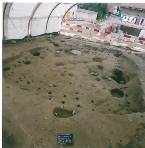
Abb. 3: Bätterkinden, Bahnhofstrasse 3. Quadratisches Grubenhaus (Seitenlänge 5,8\text{ m} , Tiefe 0,6\text{--}0,7\text{ m} ). Rings um die Sohle ziehen Pfosten-gruben und Stickellöcher, Reste der Wände und des Daches. Auf dem Boden im Hintergrund eine Steinplatte, zweifelsohne die Schwelle eines Eingangs. Blick nach Nordwesten.

Obschon nur partiell untersucht, verweisen die gefundenen Siedlungsspuren auf das mittelalterliche Dorf von Bätterkinden. In der näheren Umgebung wurde in Jegenstorf 2006 eine andere ländliche Siedlung aus dem 7./8. und 12. Jahrhundert untersucht. Wie in Bätterkinden wurden dort grossflächige Häuser entdeckt, möglicherweise der Sitz einer bedeutenden Persönlichkeit. Im Gegensatz dazu zeigt die Gruppe der Höfe von Finsterhennen, Uf der Höchi, im Seeland, im 12. Jahrhundert Wohnbauten von bescheidener Dimension.