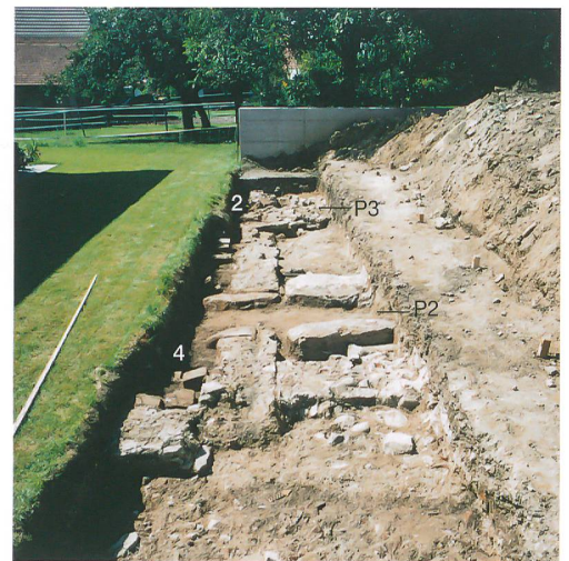
Abb. 2: Kallnach, Hinterfeld. Die Fläche südöstlich des Badetraktes. Im Hintergrund der Graben 455. Quer durch die Fläche zieht der Kanal 475, links die Hofmauer 131. Moderne Leitungsgräben stören den Befund. Blick nach Süden.

Die ersten Ergebnisse der Ausgrabungen im römischen Gutshof von Kallnach, Hinterfeld sind im Jahrbuch 2009 vorgestellt worden. Von 2009 bis 2012 konnten im Areal, das an die Grabungen von 1999 und 2007/08 angrenzt, zusätzliche Flächen von insgesamt 2215 m 2 archäologisch untersucht werden. Diese Arbeiten brachten weitere Teile der Badeanlage zur römischen Villa sowie römische und prähistorische Strukturen ausserhalb des ummauerten Gutshofgeländes zum Vorschein.