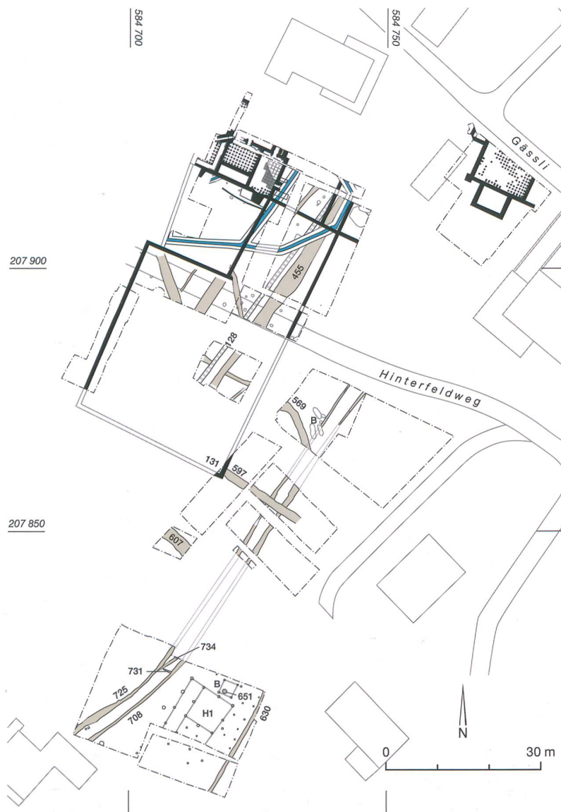
Abb. 4: Kallnach, Hinterfeld. Gesamtübersicht der Grabungen 1999 bis 2012. M. 1:1000.