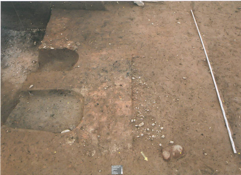
Abb. 3: Langenthal, Käsestrasse. Links: Zwei bereits ausgenommene Kadavergruben. Rechts im Vordergrund: Eine Feuerstelle mit Kiesunterlage. Im Hintergrund: Feuerstelle mit erhaltener Oberfläche. Blick nach Südwesten.