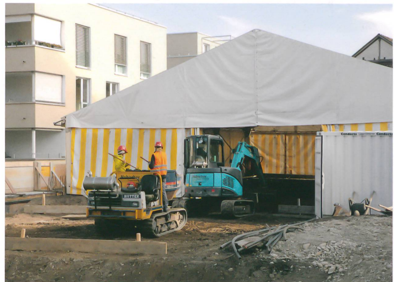
Abb. 2: Langenthal, Käsestrasse. Mit einem Bagger tragen Mitarbeiterinnen und Mitarbeiter des Archäologischen Dienstes das Sedimentpaket ab und lesen die Funde heraus. Blick nach Osten.