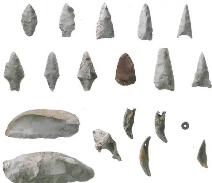
Abb. 5: Oberbipp, Steingasse. Funde aus der Grabkammer: Silexpfeilspitzen und -messer, Meeresschnecke, Tierzahnanhänger und Steinperle. Rechts unten die mesolithische Silexpitze. M. 1:2.

Abb. 4: Oberbipp, Steingasse. Für die archäologische Feinarbeit in der Grabkammer sind aus Kontaminationsgründen Mundschutz und Handschuhe notwendig.