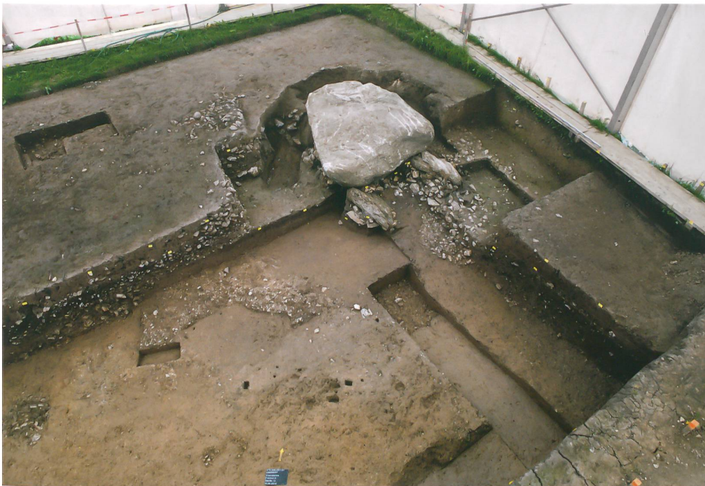
Abb. 1: Oberbipp, Steingasse. Beim Freilegen des Dolmens zeigte sich, dass er geschützt vom Geschiebe des Mühlebachs die Jahrtausende überdauerte. Blick nach Norden.

MARIANNE RAMSTEIN, DOMENIC RÜTTIMANN UND SANDRA LÖSCH