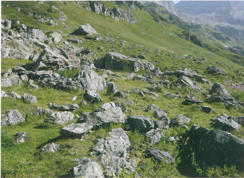
Abb. 2: Ein Blick auf die Wüstung Gadmen, Wendenlager 1 mit einer Schrägaufnahme vom Boden aus.

Veränderung der Motordrehzahl in alle Richtungen bewegen. Die Umsetzung der Steuerbefehle durch den Piloten an der Fernbedienung erfolgt am Fluggerät über eine zentrale Steuerplatine, auch Flight-Control genannt. Sie ist quasi das «Hirn» des Quadropters und neben dem Auswerten und Verarbeiten des Fernbedienungssignals und der Weitergabe der Befehle an die Motorregler für das Manövrieren zuständig. Hierfür sind verschiedene Sensoren wie Gyroscope, Beschleunigungssensoren oder ein Luftdrucksensor zur Höhenmessung und zur Stabilisierung der Flughöhe verbaut. Die Elektronik des für die Luftbilddaufnahmen verwendeten, selbst gebauten Quadropters stammt von der Firma Mikrokopter ( www.mikrokopter.de ).