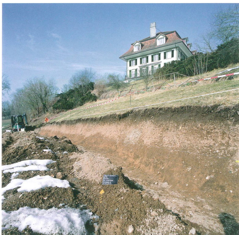
Abb. 1: Bern, Efenau. Sondierschnitt im Hangbereich der Parkanlage von 1814 unterhalb des Herrenhauses aus der Zeit um 1780. Blick nach Norden.

Auf Initiative der Stadtgärtnerei, die seit 1928/29 ihren Sitz vor Ort hat, soll die englische Parkanlage des 19. Jahrhunderts im Rahmen eines Parkpflegewerks in Ansätzen wiederhergestellt werden. Als Grundlage für die angestrebte Rekonstruktion dient der von der Grossfürstin in Auftrag gegebene Planungsentwurf des elsässischen Gartenarchitekten J. Baumann (Abb. 2). Um die dargestellten Wegverläufe und einen im Hanggelände unterhalb des Herrenhauses vermuteten Wasserlauf im Gelände zu lokalisieren, wurden in enger Zusammenarbeit mit dem Ar-