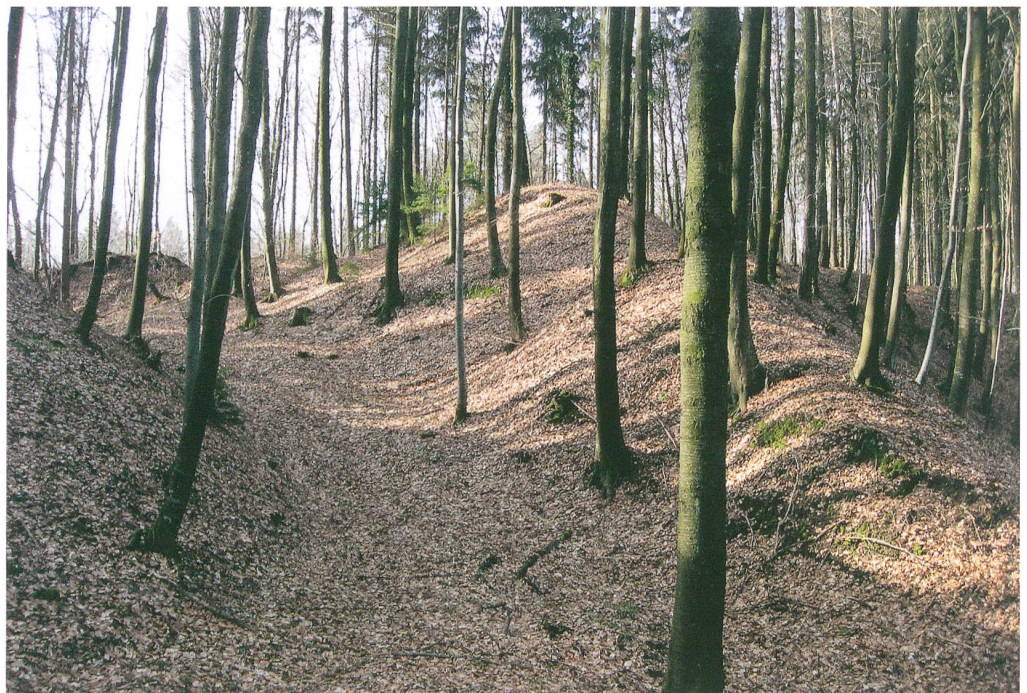
Abb. 1: Büren an der Aare, Ruine Strassberg. Mächtiger Ringgraben und Wall der Burganlage. Blick nach Süden.

Seit dem frühen 19. Jahrhundert fanden in der Burganlage wiederholt Ausgrabungen und Fundbergungen statt. Bis auf die Untersuchungen im Jahr 1949 sind diese eher als Raubgrabungen denn als systematische Ausgrabungen zu bezeichnen. Sämtliche Forschungen genügen in keiner Weise heutigen wissenschaftlichen Ansprüchen. Weithin bekannt geworden sind die zugehörigen reichen Fundinventare. Ein kleiner Teil davon wird heute im Ortsmuseum Büren und in den Historischen Museen von Basel und Bern verwahrt. Zahlreiche verzierte Bodenplatten aus Ton heben sich vom übrigen Bestand ab. Sie zeugen von der hochwertigen Ausstattung der adeligen Gemächer