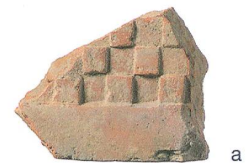
Abb. 2: Büren an der Aare, Ruine Strassberg. a: Neufund einer ornamentierten Tonfliese mit Darstellung eines Löwen. b: Zeichnung eines vergleichbaren Altfundes der Grabung von 1887. M. 1:3.