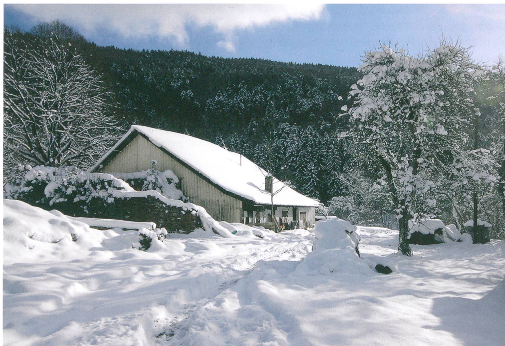
Fig. 1: Péry, Planche Nanry. La tuilerie et son four au début des investigations. Vue vers le sud.

Le projet des propriétaires actuels de transformer le bâtiment en habitation moderne s'étant avéré irréalisable, cette tuilerie est, elle aussi, menacée de démolition. C'est pourquoi le Service archéologique a procédé au relevé complet du bâti existant. Afin de pouvoir analyser