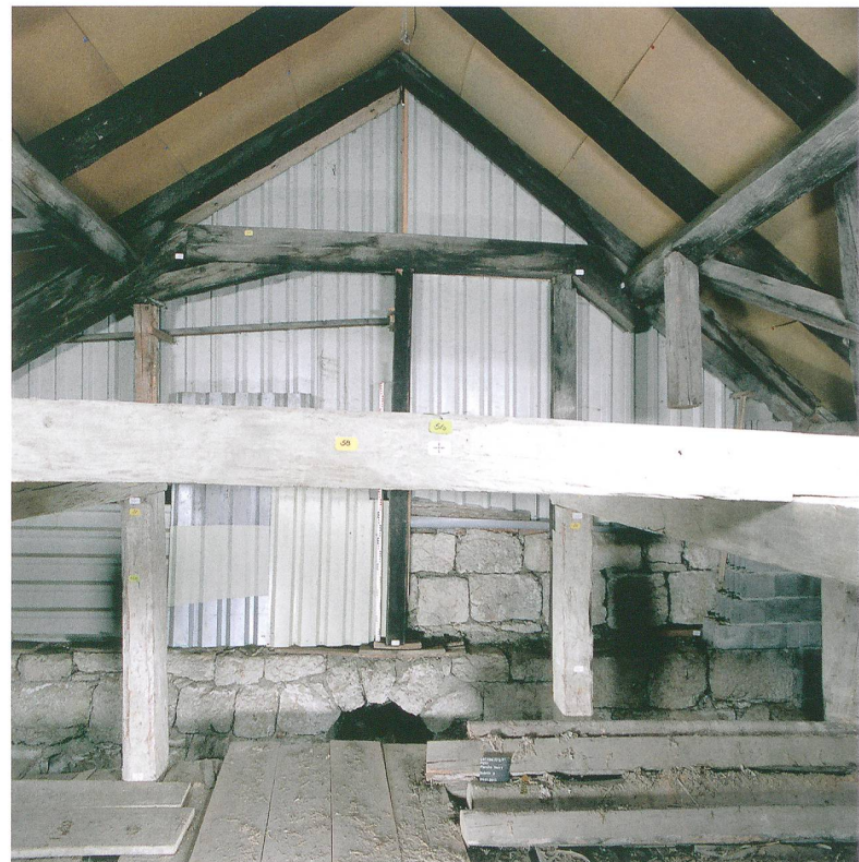
Fig. 3: Péry, Planche Nanry. Vue de l'étage supérieur de la tuilerie. Vue vers le nord.

La halle de la tuilerie, un bâtiment long de 13 m et large de 14,5 m, accolé au four est conservé. C'est vraisemblablement ici qu'avait lieu le façonnage : la pâte d'argile fraîchement préparée était moulée à la main dans des moules en bois aux dimensions normées et dont le fond était préalablement sablé. Avant de placer les briques dans le four pour la cuisson, il fallait les sécher plus ou moins longtemps à l'air. Cette étape avait également lieu dans cette