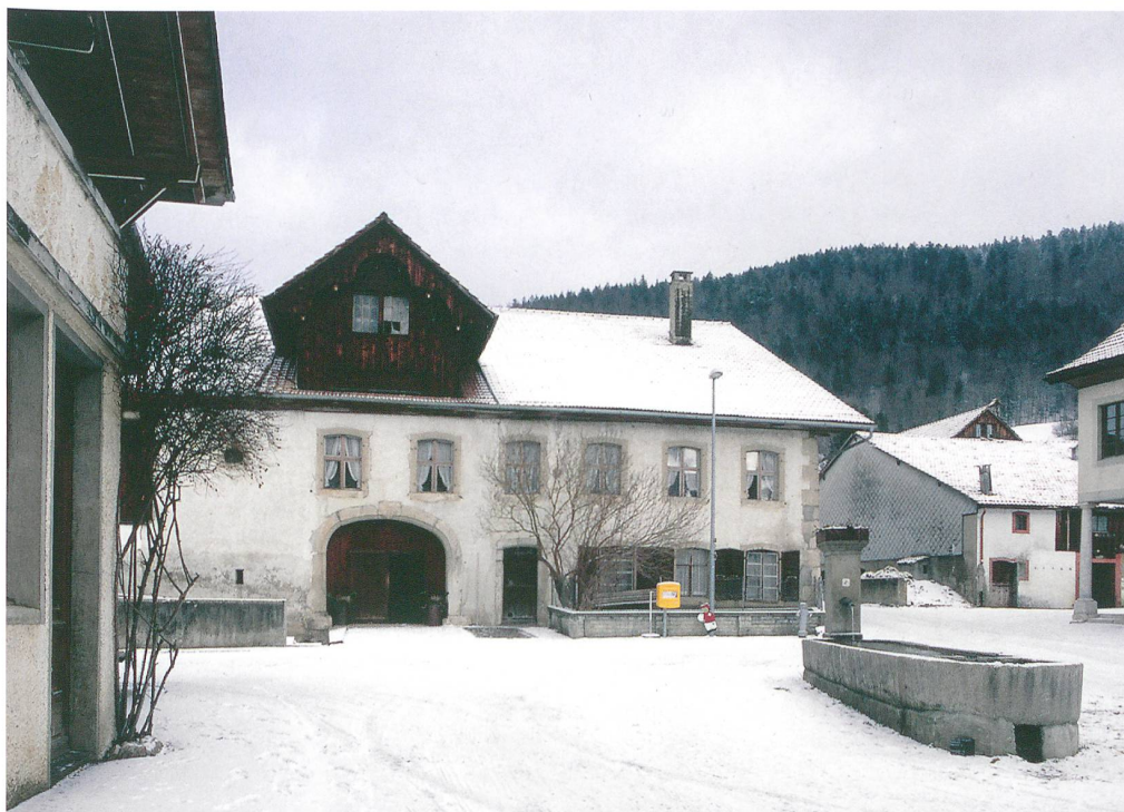
Fig. 1: Saules, Milieu du Village 9. Partie droite de la façade conservée de l'ancienne ferme-double dominant la place du village. Vue vers le nord.

Cette maison classée surprend quant à son histoire architecturale, notamment en raison des transformations, atypiques d'une maison jurassienne, qui ont eu lieu vers 1800. La façade pignon et son imposant avant-toit en berceau reflètent une tradition de la partie orientale du canton, qui pourrait suggérer un lien entre ses occupants et le milieu germanophone des menonites. Ces derniers, exposés à des persécutions dans la région de Berne, trouvèrent refuge dans les montagnes du Jura bernois. Cette hypothèse semble étayée par la présence, dans la famille Grosjean autour de l'an 1800, de prénoms bibliques tels Abraham et Isaac, répandus