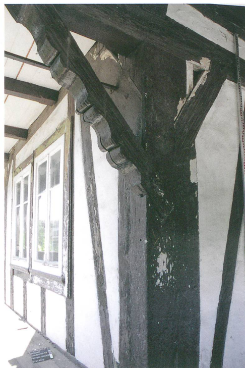
Abb. 5: Urtenen, Solothurnstrasse 53, Obergeschoss, südöstlicher Eckständer mit aufgeblatteten Kopfstreben von Phase 3.

Das Erdgeschoss konnte vermutlich von der Südostecke aus betreten werden, das