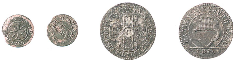
Abb. 6: Urtenen, Solothurnstrasse 53, zwei Münzen der Zeit um 1800 aus der Verfüllung zum Anbau von Phase 5a im südöstlichen Eckbereich der Wirtsstube.

Obergeschoss hingegen nur über eine Laube auf der östlichen Traufseite. Ein innenliegendes Treppenhaus gab es noch nicht. Das Erdgeschoss war bereits ähnlich gegliedert wie heute. An die Stube grenzte im Norden die Küche. Dahinter lag wiederum ein Wohnraum, vielleicht die Stube beziehungsweise Schlafkammer der Wirtsfamilie. Das Obergeschoss könnte ebenfalls schon auf der Südseite mit einer grossen Stube, einem Gastsaal, ausgestattet gewesen sein. Davor bestand wohl schon eine Laube. Rückseitig sind zwei Gästekammern anzunehmen.