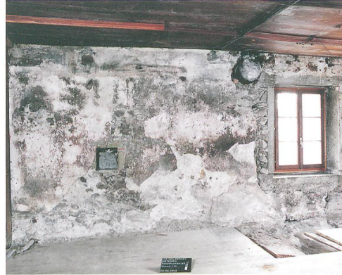
Abb. 4, rechts: Urtenen, Solothurnstrasse 53, Wirtsstube im Erdgeschoss, Ostwand des Gebäudes von Phase 2. Blick nach Nordosten.

angelegt werden, um konkreten Fragestellungen zur Bauabfolge und Nutzungsgeschichte nachzugehen. Manche Fragen werden sich deshalb erst während der Sanierungsarbeiten klären lassen (Abb. 2).