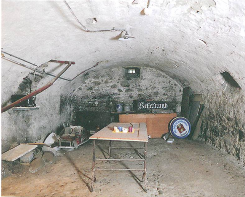
Abb. 3, links: Urtenen, Solothurnstrasse 53, Blick nach Südosten in den Keller des Kernbaus.