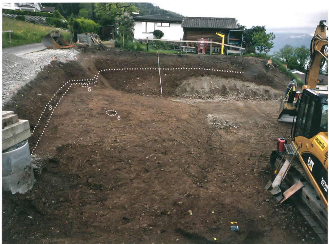
Abb. 2: Hilterfingen, Tannenbühlweg 4. Die Fundschicht 3 dehnte sich über die ganze Grabungsfläche aus. M. 1:500.

Abb. 1: Hilterfingen, Tannenbühlweg 4. Die Grabungsfläche nach dem Abbau der Fundschicht 3, die sich in den Profilen als dunkle Schicht erkennen lässt. Es zeichnen sich zwei Pfostengruben (5, 6) ab. Blick nach Osten.