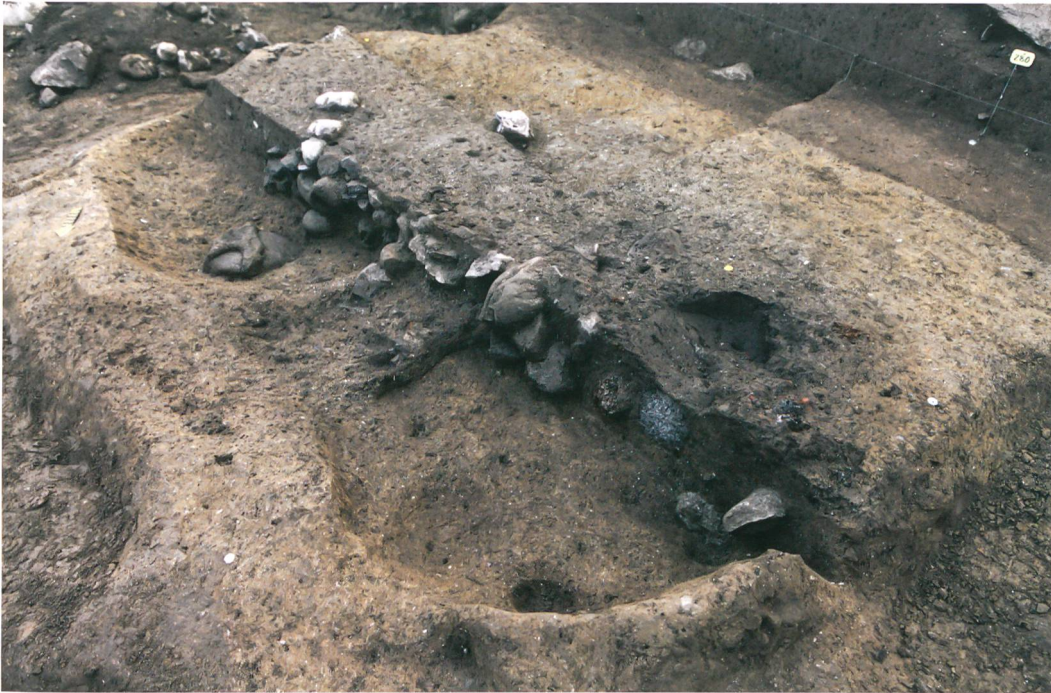
Abb. 3: Köniz, Chlywabere. Schnitt durch die Grube 262. Die verbrannten Lehmfragmente, vermutlich eines Kuppelofens, lagen in der Mulde im Vordergrund. Blick nach Süden.

Spuren, die auf ihre ursprüngliche Funktion hätten schliessen lassen, waren nicht erhalten. Die Abfälle belegen aber einen Werkplatz unbekannter Funktion in unmittelbarer Nähe. Unter der Grob- und Feinkeramik aus der Einfüllung findet sich ein Topf mit Buckel- und Ritzverzierung (Abb. 4), der Parallelen im Gräberfeld von Neftenbach ZH findet. Dieses wird in die frühe Spätbronzezeit datiert (13. Jh. v. Chr.). Die Pfostenstellungen und die Grube belegen eine Siedlungsphase, die anhand einer ersten Serie Radiokarbonanalysen an Holzkohlen in die Mittel- oder frühe Spätbronzezeit (15.–13. Jh. v. Chr.) datiert.