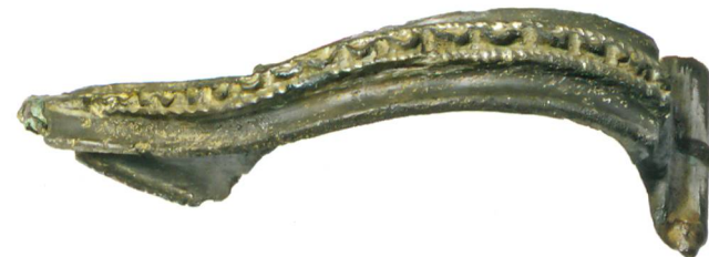
Abb. 9: Köniz, Chlywabere. Hülsenspiralfibel mit Wellenlinienverzierung. M. 2:1.