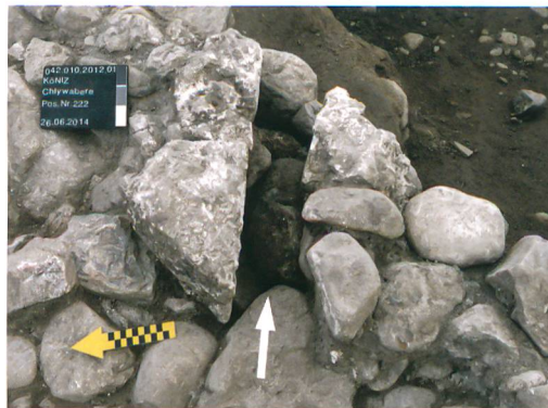
Abb. 8: Köniz, Chlywabere. Wasserversorgungskanal 222 aus Tuffsteinblöcken auf dem Fundament der Mauer 207. Pfeil: Richtung des Gefälles. Blick nach Südosten.