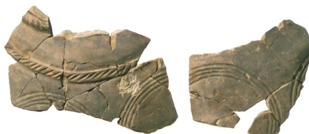
Abb. 4: Köniz, Chlywabere. Fragmente eines verzierten feinkeramischen Topfs der frühen Spätbronzezeit. M. 1:2.

In einer zweiten Phase wurde für den Bau des Gebäudes das Gelände leicht aufplaniert. Anschliessend wurden die beiden im Verband stehenden Mauern 207 und 227 erstellt. In einer nächsten Etappe folgte der Anbau der Mauern 204 und 205/206, sodass ein rechteckiger Raum von 9 \times 7,3 m mit einer Innenfläche von 54 \text{ m}^2