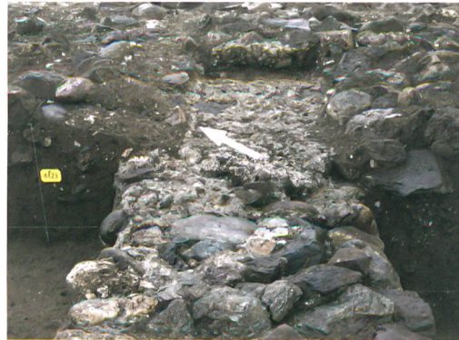
Abb. 7: Köniz, Chlywabere. Abdruck einer Schwelle (Pfeil) auf der Mauer 205/206. Blick nach Nordwesten.

Die grossflächige, gute Erhaltung archäologischer Funde und Strukturen im Wirtschaftsteil eines Gutshofes ist für den Kanton Bern – mit Ausnahme des Gutshofes von Ipsach – einzigartig. In Chlywabere ruht deshalb eine Vielzahl von Informationen zu römischer Landwirtschaft und Handwerk im Boden. Ebenso bedeutend sind die grossflächige Erhaltung von Spuren mehrerer bronzezeitlicher Siedlungen sowie Hinweise auf jungstein- und eisenzeitliche sowie mittelalterliche Phasen im Areal zwischen Chlywabere und Kehrsatz. Kommen die geplanten Projekte zur Ausführung, werden die archäologischen Rettungsgrabungen eine Fülle an neuen Erkenntnissen zur Siedlungsgeschichte von Wabern liefern.