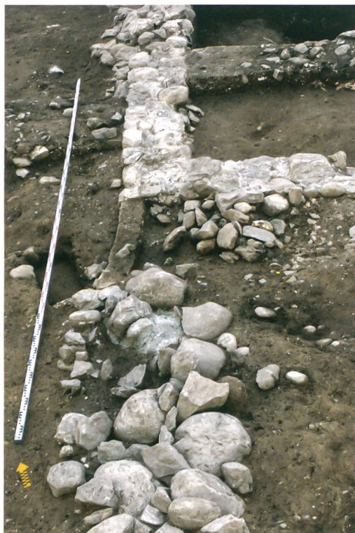
Abb. 6: Köniz, Chlywabere. Im Vordergrund das Fundament der Umfassungsmauer und dahinter die nordwestliche Gebäudeecke. Blick nach Nordosten.

Mauerwerks zeichnete sich das Negativ einer 3,35 m langen Schwelle ab (Abb. 7). Auf der Aussenseite des Raums diente eine mächtige Steinsetzung als Zugangsrampe. Der breite Eingang und die Rampe weisen das Gebäude als Wirtschafts- und nicht als Wohnbau aus.