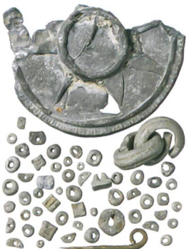
Abb. 2: Laupen. 2014 beim Goldwaschen entdeckte Metallfunde, neuzeitlich/modern. M. 1:1.

Aus den Flussbetten der Saane und Sense bei Laupen werden seit dem 19. Jahrhundert immer wieder archäologische Objekte geborgen (Abb. 1). Zu diesen Zufallsfunden gesellt sich nun ein interessantes Fundensemble, das Christoff Affolter 2014 dem Archäologischen Dienst des Kantons Bern übergab. Unter seinen beim Goldwaschen aufgesammelten Funden fallen neben zahlreichen modernen Objekten (Abb. 2) auch prähistorische und römische archäologische Funde auf.