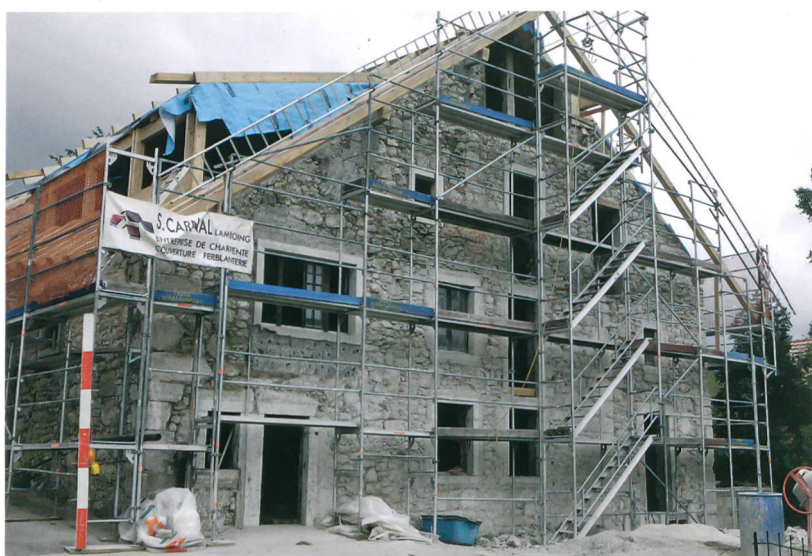
Fig. 1 : Plateau de Diesse, Lamboing, Les Moulins 1. Travaux de rénovation en cours. Vue vers le nord-est.