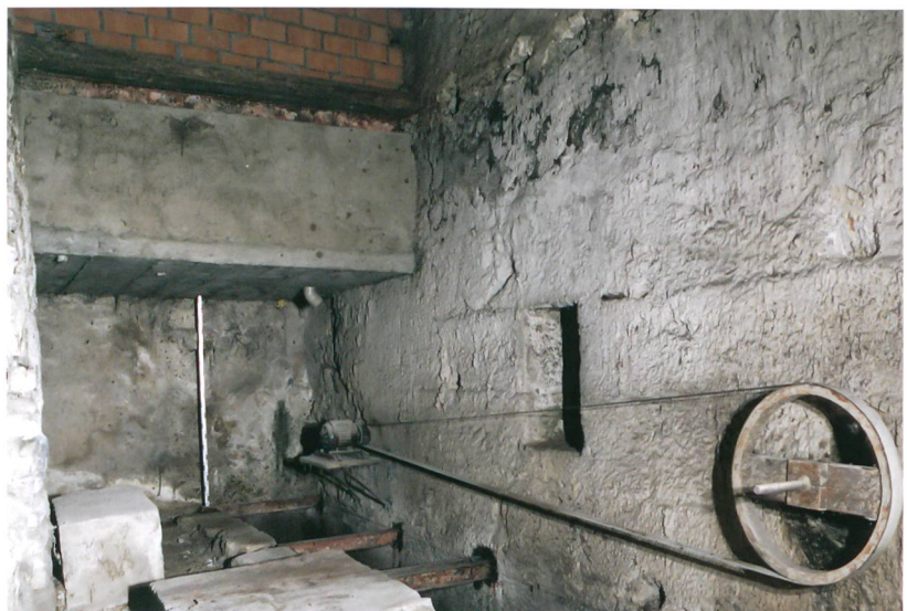
Fig. 4: Plateau de Diesse, Lamboing, Les Moulins 1. Mur en gros appareil qui à l'origine formait la façade est; le coursier maçonné témoigne de la dimension de la roue en bois aujourd'hui disparue. Vue vers le sud.

L'écurie et l'annexe nord n'ont pas été intégrées à l'analyse. Vu les dimensions du bâtiment et en admettant que le meunier stockait le grain plutôt à l'étage, dans la grange, il est envisageable qu'une écurie ait existé peut-être dès l'origine, sans que l'on connaisse toutefois ses dimensions. Un document d'archive de 1766, conservé aux Archives de l'ancien évêché de Bâle, nous apprend d'ailleurs que Jean-Jacques Crausaz, «meunier au moulin dessous le village de Lamboing», disposait d'un droit de pâture pour sa vache et ses deux chevaux.