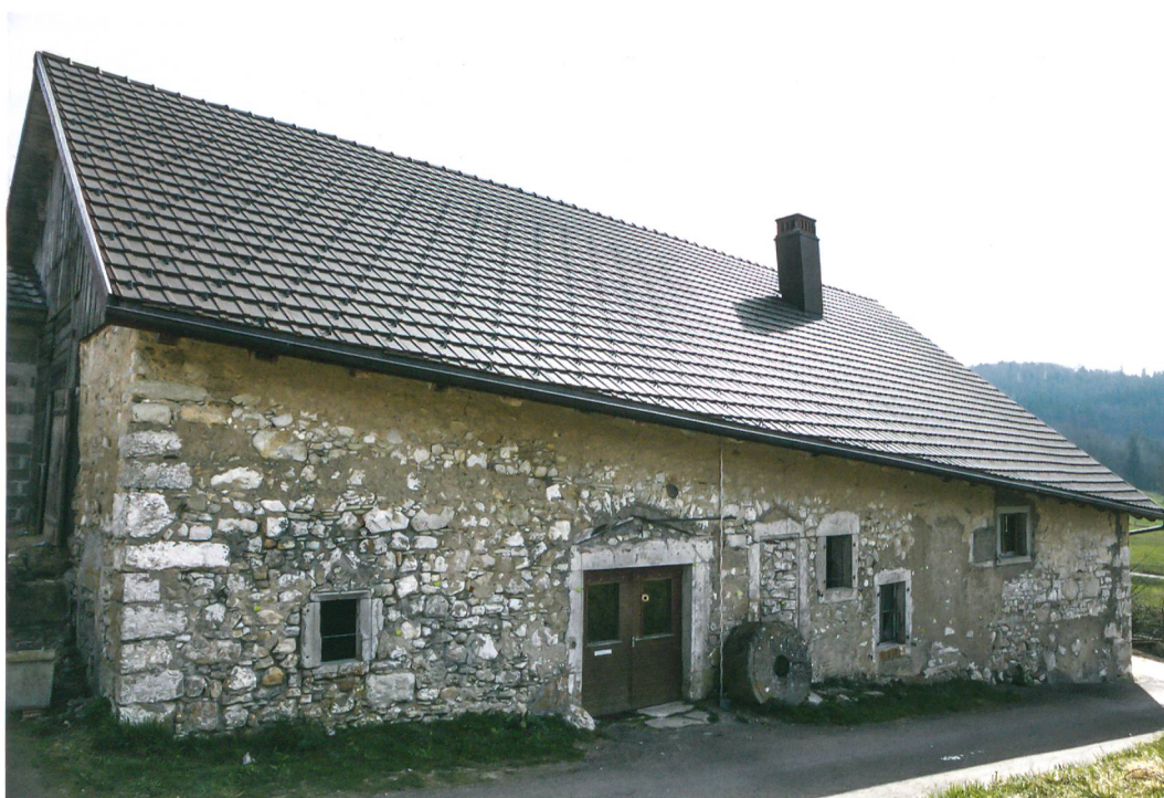
Fig. 6: Plateau de Diesse, Lamboing, Les Moulins 1. Façade ouest avant travaux. Diverses baies, parfois obturées, témoignent des modifications apportées au bâtiment au cours des générations.

Basée pour l'essentiel sur l'observation des maçonneries, l'analyse de bâti engagée sur cet ancien témoin de la meunerie locale, offre un éclairage dynamique de l'évolution d'un bâtiment patrimonial de grand intérêt. Si en l'état aucune trace de ribe n'est attestée dans ce moulin, le broyage de fruits ou de fibres végétales a fort bien pu se dérouler dans un autre moulin et la roue appuyée contre la façade être simplement récupérée.