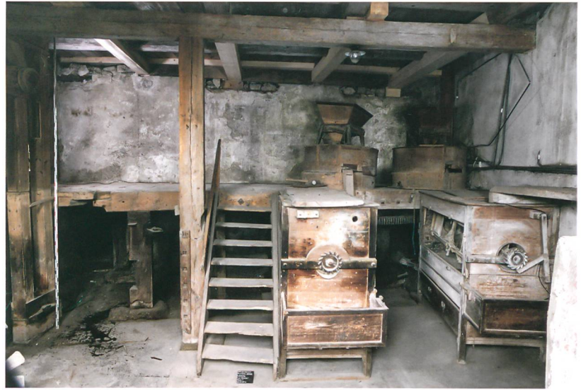
Fig. 3: Plateau de Diesse, Lamboing, Les Moulins 1. Vue intérieure du laboratoire de meunerie avant travaux. Au premier plan, deux blutoirs, à l'arrière-plan, sur le palier, deux meules surmontées de leur trémie respective. Vue vers l'est.

L'ultime chantier d'envergure (jaune) se caractérisait surtout par une série des percements opérés sur les façades sud et ouest (fig. 1 et 6). Ainsi, la façade pignon vit-elle l'ouverture de quatre fenêtres de format similaire (33), alors qu'une cinquième fenêtre éclairait la pièce sud-orientale du rez-de-chaussée. En façade ouest, l'ouverture d'une porte charretière à linteau horizontal, peut-être en remplacement d'une ancienne porte cochère voûtée, ainsi que de deux fenêtres décalées, coïncide avec l'obturation d'une porte et d'un soupirail. Ces transformations devaient découler d'une adaptation des locaux, voire de changements techniques