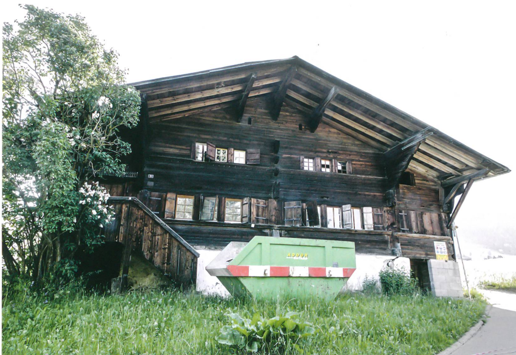
Abb. 1: Saanen-Gstaad, Litzistrasse 21. Die westliche Hauptfassade des Bauernhauses war ursprünglich schmaler. Die ehemaligen Seitenlauben sind nachträglich zu Räumen ausgebaut worden. Zur Bauzeit führten noch beidseitig Treppenaufgänge zu den Seitenlauben. Blick nach Osten.

Am südlichen Dorfrand von Gstaad direkt über dem Hang zum «Louibach» liegt ein kleines Bauernhaus. Der für das Saanenland typische Bau ist in den nach Nordosten ansteigenden Hang hineingebaut und öffnet seine Fassade nach Südwesten (Abb. 1). Bisher diente das Anwesen zwei Familien als Ferienhaus, nach dem Verkauf stehen umfangreiche Umbauten an. Im Juni 2014 bot sich dem Archäologischen Dienst des Kantons Bern dadurch die Gelegenheit, den Bestand des Hauses aufzunehmen und die Bauentwicklung nachzuvollziehen. Im Zentrum dieses Kurzberichtes steht die für das Saanenhaus des 17. Jahrhunderts charakteristische bauzeitliche Struktur.