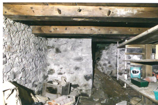
Abb. 2: Saanen-Gstaad, Litzistrasse 21. Die Ostwand im südlichen Kellerraum weist einen auffälligen Versatz auf. Auf zwei Dritteln der Länge ist sie um 1,4 m nach Osten versetzt. Der Grund hierfür bleibt unbekannt. Blick nach Osten.

Das Kellergeschoss bestand aus zwei nahezu gleich grossen Räumen, die im Bereich der Firstlinie durch eine Binnenmauer getrennt