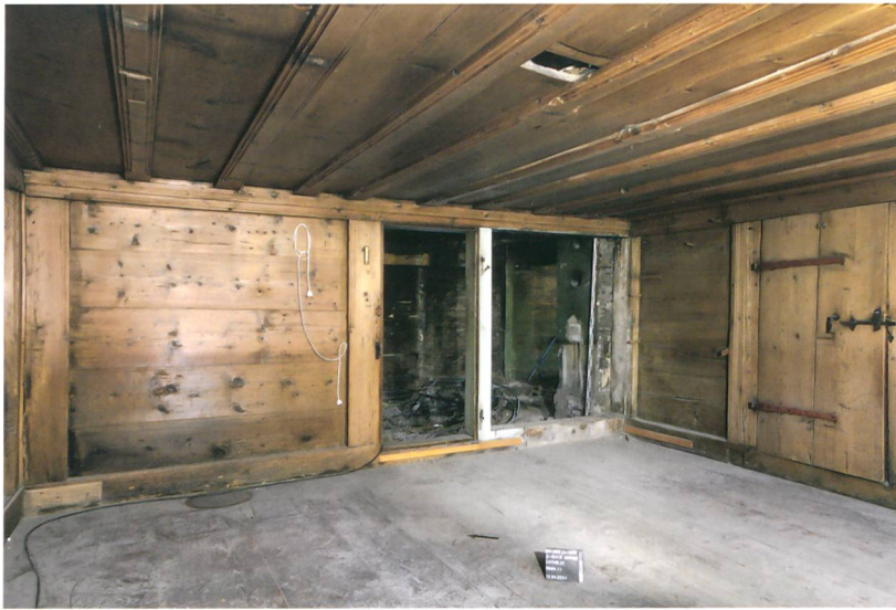
Abb. 3: Saanen-Gstaad, Litzistrasse 21. Die Stuben sind als Bohlen-Ständerkonstruktion errichtet. Alle vorkragenden Elemente sind durch eine Profilierung betont, die sich auch an den Balken der Decke finden. Blick nach Osten.