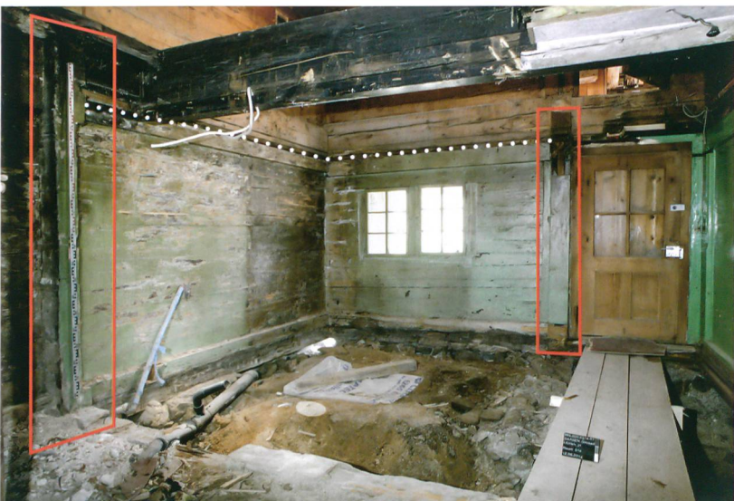
Abb. 4: Saanen-Gstaad, Litzistrasse 21. In der Südostecke befand sich einst eine Küchenstube. Ihre Ausdehnung ist anhand der Deckennut (weisse Punkte) und der beiden zurückgesägten Blockverbände (rot eingeraht) abzulesen. Blick nach Südosten.

und durch je eine Türe in der Westfassade zugänglich sind. Jüngere Veränderungen an den Maueröffnungen lassen eine im Ursprung leicht veränderte Zugangssituation mit kleineren Maueröffnungen vermuten. Ungewöhnlich ist ein Mauerversatz in der Ostwand des südlichen Kellerraums. Der Raum ist hier auf zwei Dritteln seiner Fläche um die Gangbreite des Erdgeschosses nach Osten erweitert (Abb. 2). Die Ursache dieses Versatzes bleibt vorerst offen. Ein möglicher interner Zugang über eine Falltür im Gang des Erdgeschosses scheint als Erklärung auszuschließen, da entsprechende Indizien wie Balkenlöcher oder ein Treppennegativ fehlen.