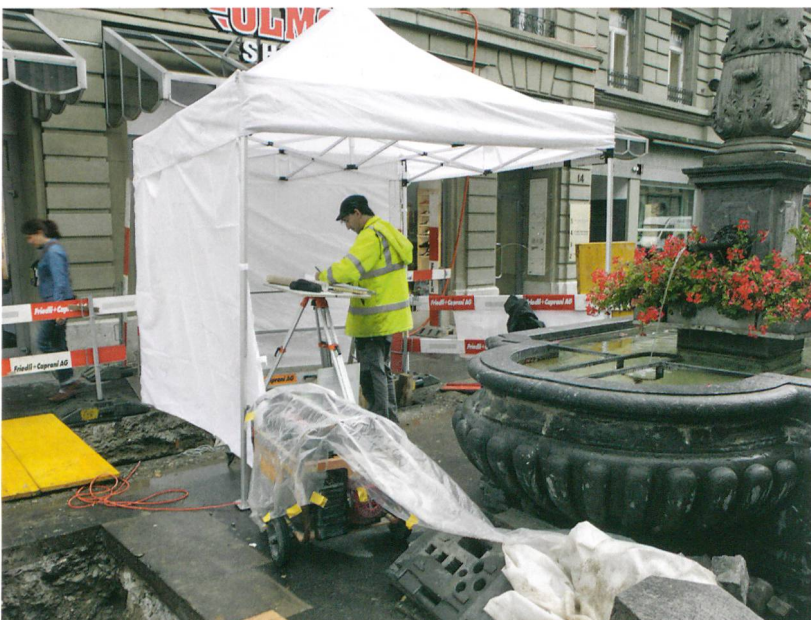
Abb. 1: Bern, Zeughausgasse. Neben dem Lindenbrunnen erfolgte der Neubau einer Trafostation. Zudem musste hier ein gassenquerender Leitungsgraben neu angelegt werden. Blick nach Nordosten.

Noch vor der Reformation wurde im Bereich des klösterlichen Baumgartens der städtische Werkhof erbaut. Aus einfacheren Holzgebäuden entstand mit der Zeit das mächtige Zeughaus, welches der Gasse ihren heutigen Namen gab. Vom 1876 abgerissenen Gebäude wurde die Nordwestecke aus Sandstein-