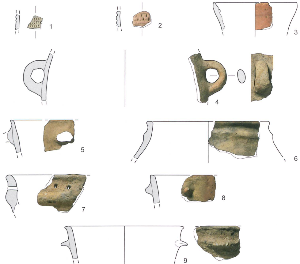
Abb. 4: Büren an der Aare, Aarbergstrasse 5, 7, 9. Glockenbecherzeitliche Keramik. 1–3 dekorierte, geglättete Feinkeramik, vermutlich Becher; 4–9 Gebrauchskeramik. M. 1:3.

Zudem gibt es offene Formen wie Schalen oder Schüsseln, einige davon mit Standfuss. Unter den übrigen Verzierungen oder Greifhilfen sind Griffzungen und Knubben zu beobachten (Abb. 4,8–9).