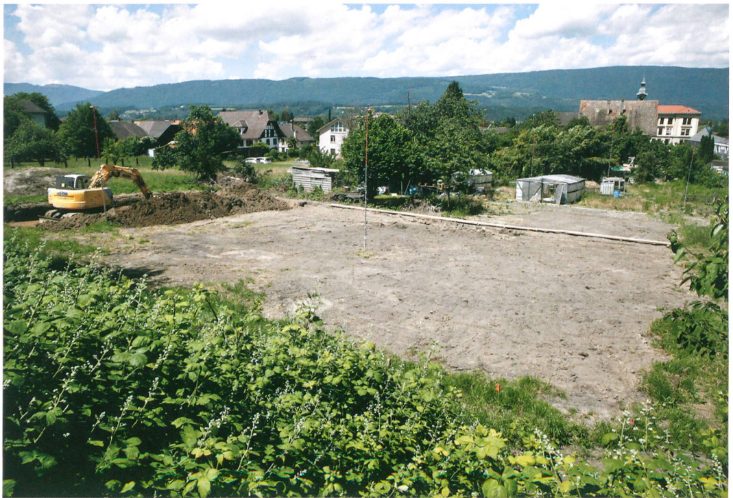
Abb. 1: Büren an der Aare, Aarbergstrasse 5, 7, 9. Grabungssituation. Blick nach Nordwesten.

Ein Überbauungsprojekt an der Aarbergstrasse in Büren an der Aare löste im März 2015 die Durchführung von Baggersondierungen aus. Ziel war es, den hier vermuteten Abschnitt der römischen Strasse zu finden, die Solothurn mit Studen-Petinesca und Avenches verbindet. Stattdessen wurde eine auffällige Menge urgeschichtlicher Keramik sowie einige Gruben mit neuzeitlichem Material beobachtet. Diese Entdeckung führte zu einer einmonatigen Grabung im Mai/Juni 2015 auf einer Fläche von 550 m 2 . Die Abstiche wurden vorwiegend mit dem Bagger abgetragen. Manuelle Einsätze erfolgten im Bereich von Strukturen und bedeutenden Fundkonzentrationen.