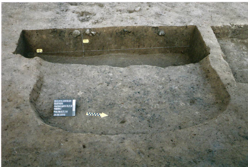
Abb. 5: Büren an der Aare, Aarbergstrasse 5, 7, 9. Schnitt durch die Einfüllung der Grube, die von der Keramik in die Spätbronzezeit (Stufe Bz D/ Ha A1) datiert wird.

Ein Radiokarbondatum stammt von Holzkohle, die direkt unter einem fragmentierten glockenbecherzeitlichen Gefäss geborgen wurde (Abb. 6, ETH-66044). Das Resultat umfasst hauptsächlich das 24. und 23. Jahrhundert v. Chr., also die Glockenbecherzeit in der Schweiz.