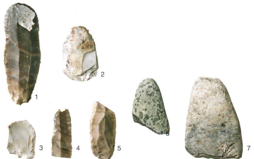
Abb. 3: Büren an der Aare, Aarbergstrasse 5, 7, 9. Glockenbecherzeitliche Steinartefakte. 1 Kratzer auf retuschierte Klinge; 2 Kratzer auf Cortexabschlag; 3 ausgesplittertes Stück; 4–5 retuschierte Klingenfragmente; 6–7 Beilklingenfragmente aus alpinem Grünstein. M. 1:2.

Die Gefässoberflächen wurden recht gleichmässig geglättet, und der Brand in einer am Ende oxidierenden Atmosphäre verlieh ihnen eine orangene bis hellbraune oder orangefarbene Färbung. Trotz der starken Fragmentierung können bei der Gebrauchskeramik 14 Gefässtypen unterschieden werden. Dazu gehören in erster Linie Formen mit im Querschnitt ovalen Henkeln (Abb. 4,4–5), Töpfe mit direkt unter dem Rand angebrachter glatter Leiste, teilweise mit darüberliegender Lochreihe (Abb. 4,6–7), sowie unverzierte Becher mit s-förmigem Profil.