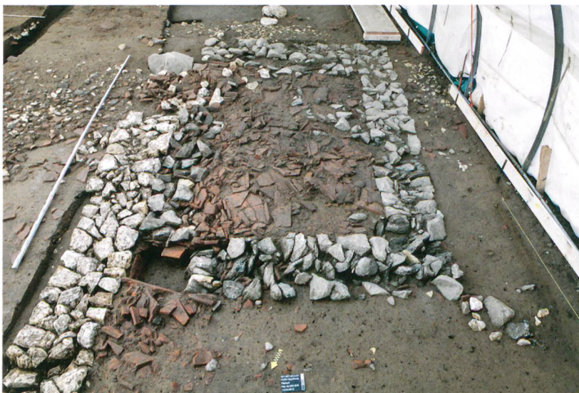
Abb. 5: Port, Bellevue. An Kalksteinmauer gebautes Latrinengebäude mit Ziegelplanie. Der Sammelkasten für organische Reste am Ende des mit Steinen verfüllten Latrinengrabens ist links im Vordergrund zu sehen. Blick nach Süden.

welchem Reste eines Hypokausts entdeckt wurden (Abb. 1 und 2). Auf dem Mörtelstrich sind die Abdrücke von Hypokaustpfeilern zu erkennen. Südlich davon lag ein kleiner Raum, dessen Bodenrollierung erhalten war und in dem drei Fibeln gefunden wurden. Dieser Raum wird als Apodyterium, als Umkleieraum, interpretiert. In westlicher Richtung führt er zu einem Apsisraum, der mit hydraulischem Mörtel verputzt war. Es wird an dieser Stelle eine Badeanlage vermutet.