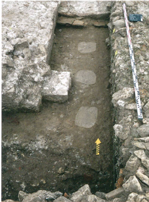
Abb. 3: Port, Bellevue. Fundamente der rechteckigen Mauer (rot) und der später angebauten Apsis (blau). Blick nach Süden.

Abb. 2: Port, Bellevue. Die Sondierung im Apsisraum brachte Abdrücke (weisslich hervorgehoben) der Hypokaustpfeiler im Mörtelstrich zum Vorschein. Blick nach Norden.