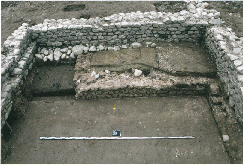
Abb. 4: Port, Bellevue. Keller aus Tuffmauern mit Treppenwand und Kellerboden aus Gussmörtel. Man erkennt die Versiegelung der Treppe durch Fundamentsteine für die jüngere Kalksteinmauer. Blick nach Süden.