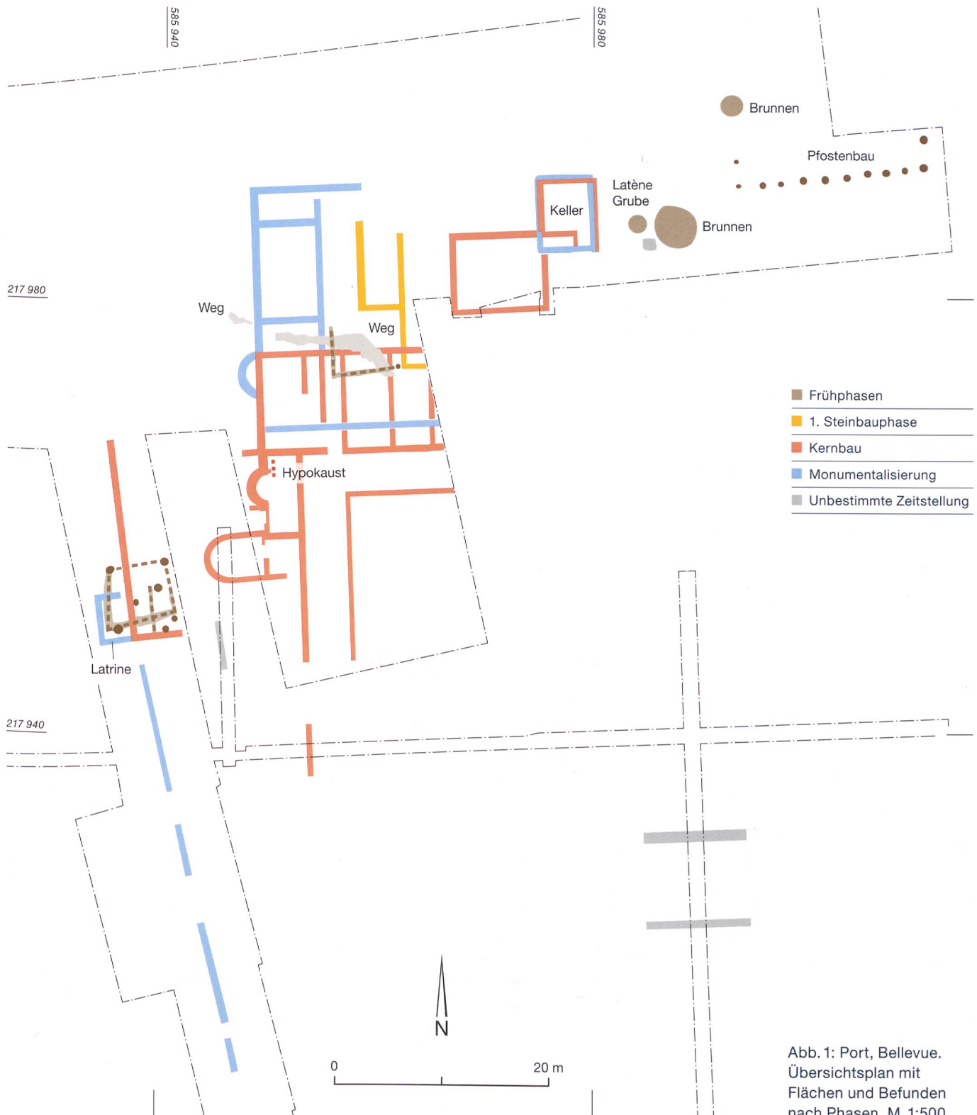
Abb. 1: Port, Bellevue. Übersichtsplan mit Flächen und Befunden nach Phasen. M. 1:500