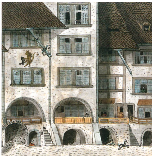
Abb. 5: Oberst Johannes Knechtenhofer zeichnete in den ersten Jahren des 19. Jahrhunderts die Häusergruppe, wie sie sich vor den Modernisierungen präsentierte. Ganz rechts Haus Nr. 28 mit der Gassentreppe, welche auch das Wohngeschoss von Nachbarhaus Nr. 30 erschloss. Das links folgende Häuserpaar Nr. 32 und Nr. 34 war noch im Besitz der alten Hochlauben.

Aus heutiger Sicht stellte sich das Vorrücken der Fassade vom Haus Nr. 30 als glückliche Fügung heraus. Als nämlich im Ladengeschoss 1907 der Einbau der exquisiten Ladenfront erfolgte, brach man das alte Tonnengewölbe nur unvollständig ab, sodass sich sein Rest bis heute erhalten konnte. Womöglich stand die vorgerückte Fassade des frühen 19. Jahrhunderts auf dem Gewölbe und hatte mittlerweile statische Schäden verursacht. Jetzt wurden die Lastlinien über eine stabile Konstruktion aus Backsteinpfeilern und Stahlträgern gebündelt und sauber auf tief gegründete Fundamente abgeleitet. Diese Massnahme dürfte den Kellerhals und das ältere Fussbodenniveau zerstört haben. Ein Mauerdurchbruch (27) mit einem neuen, höher gelegenen Durchgang (26) verband nun den Keller mit dem Gassengeschoss. Der Boden wurde mit einer Aufschüttung (2) angehoben.