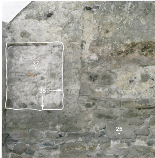
Abb. 3: Thun, Obere Hauptgasse 30. Südwestliche Wand des Gassengeschosses im Zustand vor der Sanierung im Dezember 2015. Der Ausschnitt zeigt die Fensteröffnung (35) der ehemaligen Fassade (25). Die Öffnung wurde später mit dem Mauerwerk (37) verschlossen.

Als wichtiger Aspekt zum Verständnis der folgenden vier Bauphasen muss die Geländesituation kurz skizziert werden. Das Areal liegt wegen der hangseitigen Lage auf einer Geländestufe zwischen dem Gassenniveau und dem bis zu 2 m tieferen ehemaligen Gässchen am heutigen Mühlplatz (Abb. 1). Die Geschosserschliessungen erfordern deshalb bauliche Lösungen, welche für Häuser mit hangseitiger Lage typisch sind.