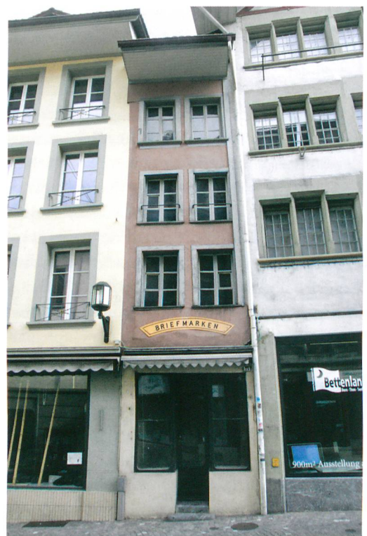
Abb. 2: Thun, Obere Hauptgasse 75. Fassadenansicht mit Blick nach Norden. Das Erdgeschoss wurde 1910 mit einer Schaufensterfront versehen. Die übrige Fassade zeigt die Gliederung aus der Zeit des sogenannten Rüfenacht-Hauses vor 1780, rechts das sogenannte Tschagggeny-Haus. Aufnahme von 2014.

Den hinteren Hausteil schliesst eine Bruchsteinmauer ab. Sie verlief einst weiter ostwärts und reichte bis ins heutige Nachbargrundstück Nr. 77 hinein. Die Mauer gehörte zum rückwärtigen Teil des ältesten Hauses (Abb. 3, Phase 1). Dort erhielt sich auch das originale Fussbodenniveau, welches über einen Meter höher als dasjenige im Vorderteil des heutigen Gebäudes lag. Zur übrigen Gestalt des ältesten Hauses fehlen verlässliche Informationen.