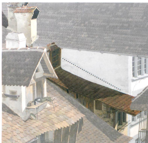
Abb. 4: Thun, Obere Hauptgasse 75. Der Ausschnitt aus dem Thun-Panorama von Marquard Wocher zeigt die Häuser Nr. 77 (rechts oben) und Nr. 75 (links daneben) im Zustand des frühen 19. Jahrhunderts. Die Punktlinie markiert den Abdruck des älteren Daches.