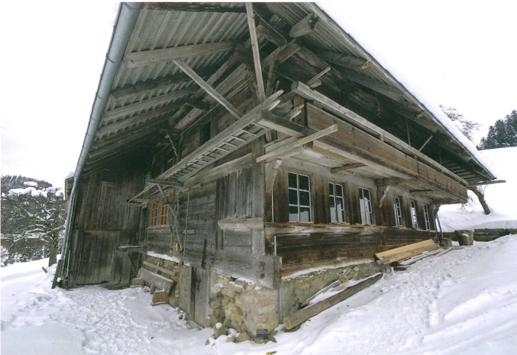
Abb. 1: Trachselwald, Vorder Giselguet 146. Die starke Hanglage ist gut zu erkennen. In der Nordfassade zeigt sich die Kellertüre, über dem gemauerten Sockel liegt der mächtige Schwellenkranz mit Zapfenschloss. Nordseitig in der Ecke ist das mit Brettern verschlossene letzte originale Fenster zu sehen. Blick nach Südosten.