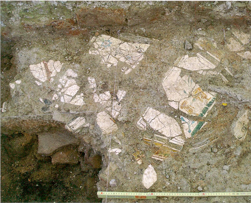
Abb. 2: Kallnach, Hinterfeld. Bemalter Verputz der exedra in Fundlage.