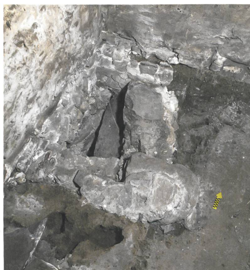
Abb. 5: Brienz, Oberdorfstrasse 92. Treppenabgang von der Rauchküche des Kernbaus von 1495/1498 ins Kellergeschoss. Bei der Teilung des Hauses wurde er zugemauert. Blick nach Westen.

Abb. 4: Brienz, Oberdorfstrasse 92. Oberer Abschnitt der zweigeschossigen Rauchküche mit der rückwärtigen Giebelwand des Blockbaus von 1498. Die Wand darunter wurde erst nach Aufgabe der Rauchküche eingefügt. Die Ziegelwand stammt von der Sanierung im westlichen Hausteil 1984. Blick nach Nordwesten.