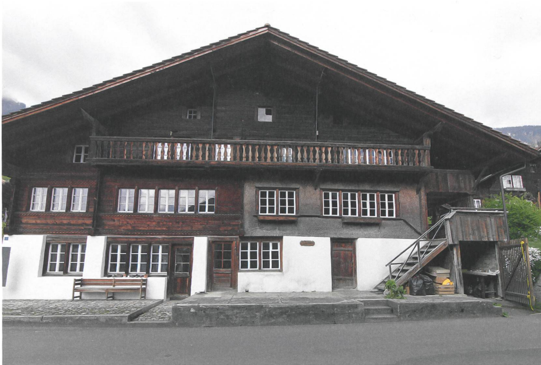
Abb. 1: Brienz, Oberdorfstrasse 92. Strassen- seite des zweigeteilten alpinen Blockbaus mit der Stubenzone im hoch gelegenen Erdgeschoss, darunter das gemauerte ebenerdige Kellerge- schoss und darüber das Dachgeschoss mit den Gadenkammern. Blick nach Norden.

Seit 1982 hat die Geigenbauschule Brienz ihren Sitz an der Oberdorfstrasse 94. Der westliche Hausteil des hier vorgestellten traditionellen Berner Oberländer Hauses (Abb. 1) war bereits 1984 für die Schulnutzung saniert und weitgehend entkernt worden. Die damaligen Umbauten erfolgten ohne wissenschaftliche Begleitung. Um die Schulgebäude den gestiegenen Anforderungen anzupassen, sollte im Rahmen eines grundlegenden Umbaus der gesamten Liegenschaft der bislang noch als Wohnhaus genutzte östliche Hausteil, Oberdorfstrasse 92, in die Nutzung einbezogen werden. Von Beginn an wurden diesmal die Planungen und Bauarbeiten bauarchäologisch betreut. Damit konnte erstmals ein Gebäude des in Brienz noch reichlich erhaltenen spätmittelalterlich-frühneuzeitlichen Baubestands eingehend durch den Archäologischen Dienst des Kantons Bern erforscht werden. Die Untersuchungen führten 2016/17 zu erstaunlichen Ergebnissen zur Bau- und Nut-