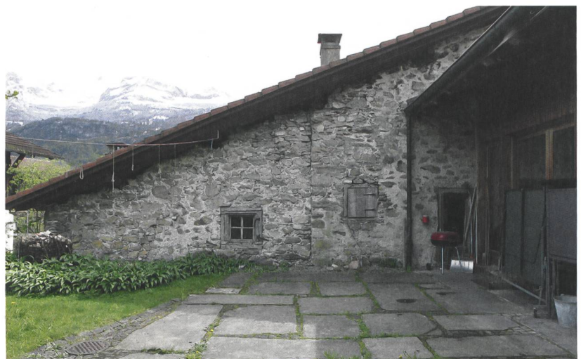
Abb. 2: Brienz, Oberdorfstrasse 92. Hofseite des östlichen Hausteils mit dem gemauerten Küchen- und Gewerbetrakt. Eine Baunaht deutet die östliche Erweiterung an. Rechts schliesst der moderne Trakt der Geigenbauschule an (Oberdorfstrasse 94). Blick nach Süden.

zungsgeschichte des an der ehemaligen Säumer- und Pilgerroute zum Brünigpass gelegenen historischen Gebäudes. Die zu einigen Bauhölzern ermittelten Dendrodaten belegen einen frühen Baubeginn in den Jahren kurz vor 1500.