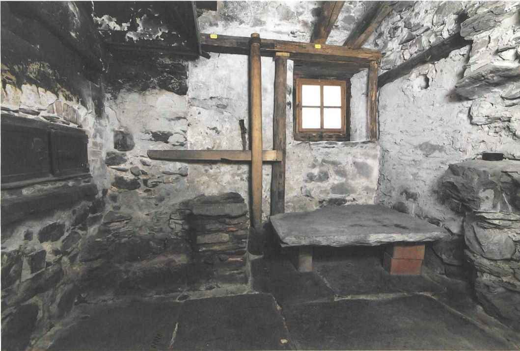
Abb. 7: Brienz, Oberdorfstrasse 92. Gewerblich genutzter Raum im Hinterhaus des östlichen Hausteils vor den aktuellen Baumassnahmen. Vor den mehrphasigen Mauern des Steinbaus sind von der neuzeitlichen Ausstattung links ein Ofen und daneben Reste einer Feuerstelle mit Galgen erhalten. Blick nach Norden.

gebäude. Der Umbau des gesamten Gebäudes für die Geigenbauschule und der Einbau eines Musiksaals haben zu schmerzhaften Eingriffen in den gewachsenen historischen Baubestand geführt. Immerhin bleiben prägende Elemente der Bau- und Hausgeschichte an der südlichen Giebelseite und im Hinterhaus erhalten.