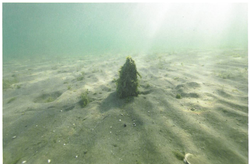
Abb. 3: Gampelen, Insel Witzwil. Erodierter Pfahl. Deutlich zeichnen sich die Rippelmarken am Seegrund ab.

und Erhaltung (Abb. 2). Die bereits vor hundert Jahren festgestellte Ausrichtung der Konstruktionshölzer zeichnet sich trotz scheinbar dezimiertem Bestand noch heute ab. Die