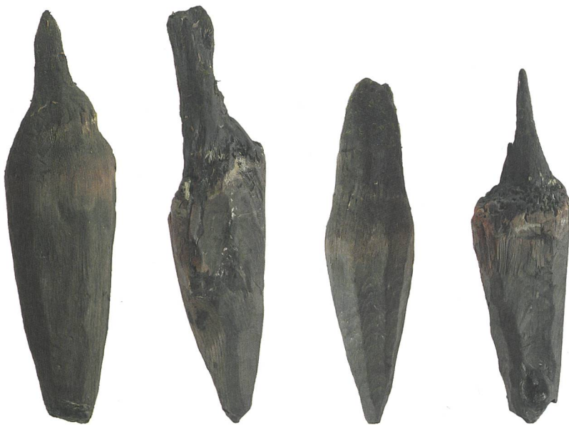
Abb. 4: Gampelen, Insel Witzwil. Bis in den zugespitzten Bereich erodierte Pfähle. M. 1:6.

Mehrheit der ausschliesslich aus Eichen gefertigten Pfähle sind bis in den zugespitzten Bereich erodiert. Häufig sind zwar noch Splintreste erhalten, der letzte Jahrring, die Waldkante, ist aber kaum je vorhanden. Manche Pfähle konnten ohne besonderen Kraftakt vollständig aus dem Sediment gezogen werden (Abb. 4). Mit andern hatte bereits die Natur ein Kräftemessen veranstaltet, lagen sie doch komplett freigespült am Seegrund. Die geringe Anzahl an Jahrringen sowie das heterogene Wachstumsbild der insgesamt 16 Holzproben bereitete der dendrochronologischen Analyse Schwierigkeiten. Nur ein Pfahl konnte im Kernholz ins Jahr 1100 v. Chr. datiert werden (Abb. 2, Fnr. 99641). Wie viele Ringe bis zum Schlagjahr noch fehlen, kann jedoch nicht beurteilt werden.