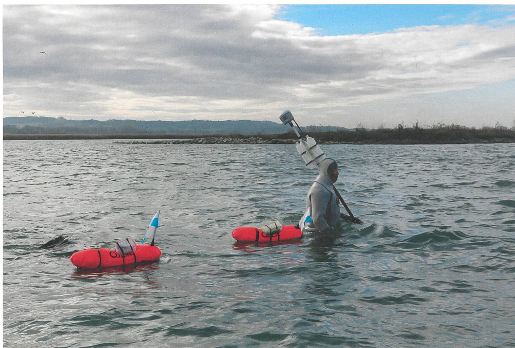
Abb. 1: Gampelen, Insel Witzwil. Vermessungsarbeiten in der Fundstelle. Im Hintergrund die östliche Vogelinsel des Reservates Fanel.

Im Nordosten des Neuenburgersees liegt die wenig bekannte Seeufersiedlung Gampelen, Insel Witzwil. Die spätbronzezeitliche Fundstelle wurde zwar schon 1914 durch eine Privatperson aus Witzwil entdeckt. Erste Ausgrabungen fanden allerdings erst 1920/21 statt, als infolge einer aussergewöhnlichen Trockenheit der Seespiegel genügend tief lag, um das Areal zu begehen. Neben der üblichen «Jagd nach Funden» wurde – wie auch bei andern Seeufersiedlungen im Neuenburger- und Murtensee – die günstige Ausgangslage dazu genutzt, einen detaillierten Plan der trocken liegenden Pfähle aufzunehmen. Darauf lässt sich deutlich eine nordwestlich-südöstliche Ausrichtung sowie eine geregelte Anordnung der Pfähle erkennen, was auf eine einphasige Siedlung schliessen lässt.