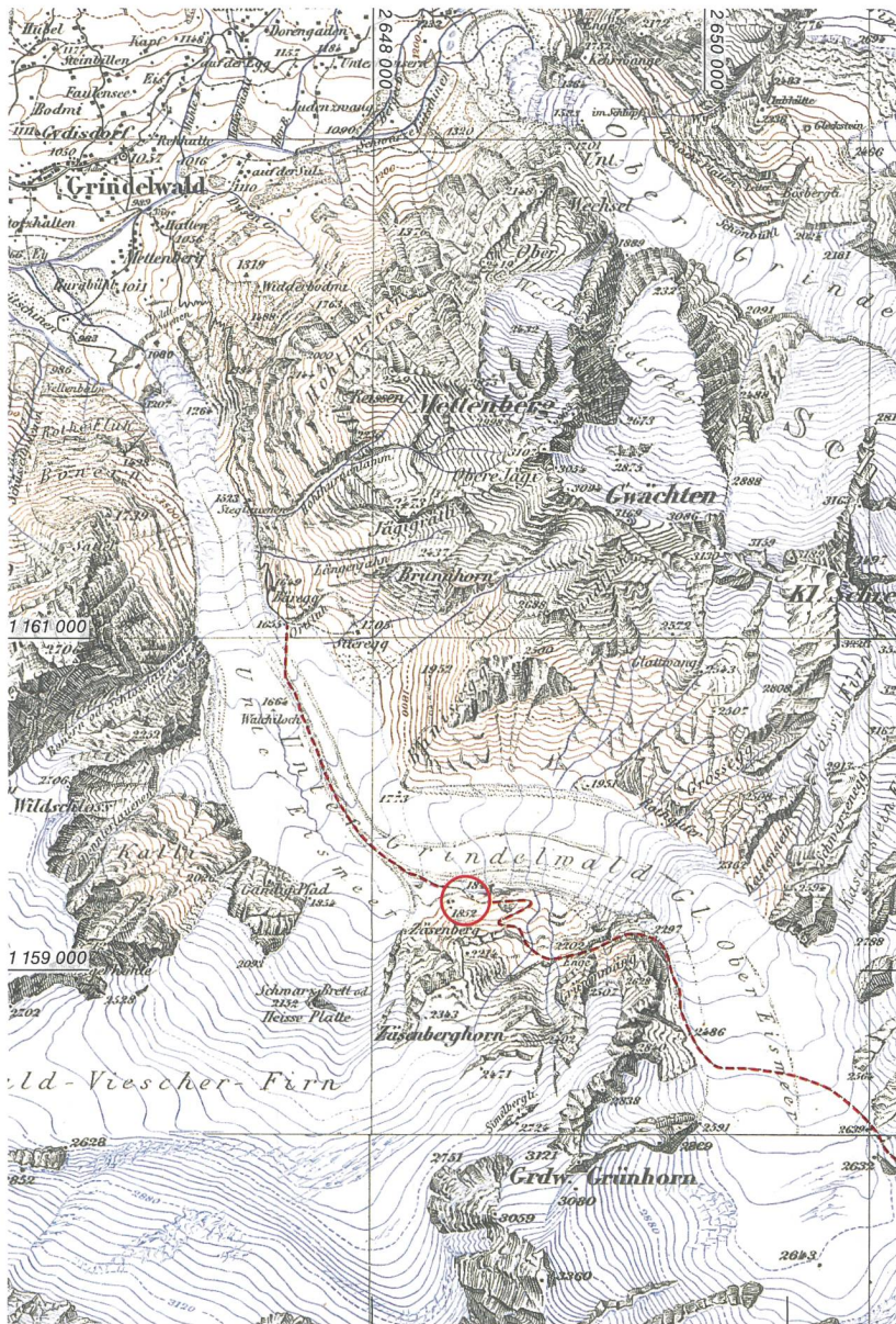
Abb. 2: Grindelwald, Zäsenberg. Auf der Siegfriedkarte von 1870 verläuft der Weg von Grindelwald und der Bäegg über den Unteren Grindelwaldgletscher auf den Zäsenberg, wo zwei Gebäude eingezeichnet sind. Die Fortsetzung des Weges führte über die Grashänge über dem Zäsenberg auf das Obere Eismeer Richtung Strahlegg oder Finsteraarjoch. M. 1:50000.