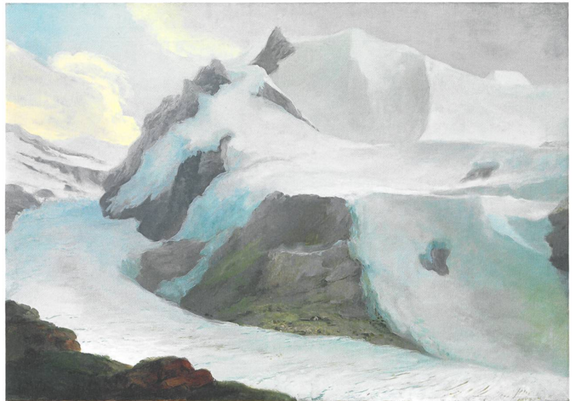
Abb. 3: Grindelwald, Zäsenberg. Caspar Wolf malte 1774 den Blick von der Bänisegg über den Unterer Grindelwaldgletscher und das Fiescherhornmassiv. Auf den grünen Matten des Zäsenbergs steht eine Alphütte. Kunst Museum Winterthur, Stiftung Oskar Reinhart.

Auf diesen Fotografien und einer Skizze von John Sargent von 1870 sind zwei Hütten mit Pultdächern zu sehen, die sich an den auffallenden Felsblock lehnen. Sie sind auch im Gelände noch heute sehr gut erkennbar mit bis zu 2,2 m hohen und 1,5 m starken Trockenmauern (Abb. 4,8 und Abb. 6). Das Gebäude bestand aus zwei Räumen (Innenmasse 3 \times 3 m und