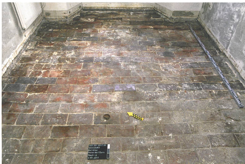
Fig. 4 : Saicourt, Bellelay, L'Abbaye 1. 1 er étage : détail du sol d'origine en tomettes de terre cuite daté de 1701. Vue vers l'est.