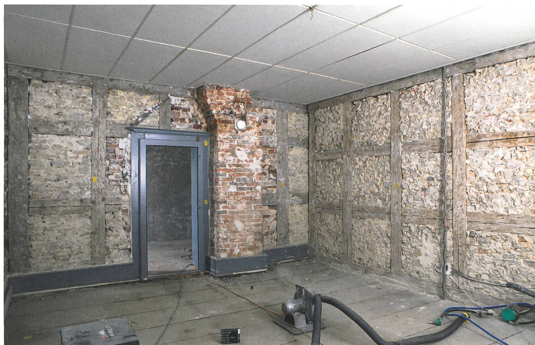
Fig. 6 : Saicourt, Bellelay, L'Abbaye 1. Au 2 ème étage, les murs porteurs sont réalisés en pan de bois hordé. Dans la pièce nord-est, l'agrandissement du canal de fumée entraîna le déplacement de la porte. Vue vers le sud.

deux grandes salles et de quatre chambres au moins. Aux 19 e -20 e siècles, les canaux de cheminée furent modifiés ou agrandis (phase 3), et une salle d'eau privative vint équiper le logement de l'aubergiste.