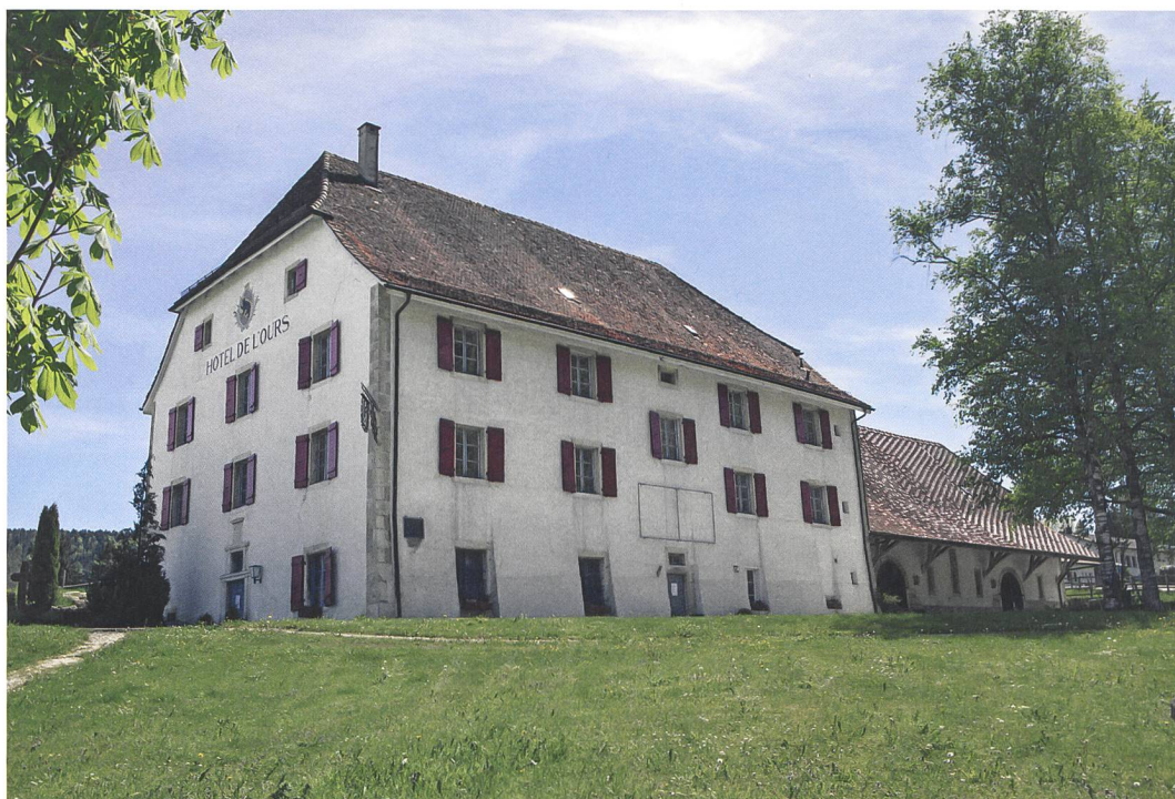
Fig. 1 : Saicourt, Bellelay, L'Abbaye 1. L'imposante bâtisse de l'Hôtel de l'Ours édiflée dès 1697. Vue vers le sud.

Situé à un peu plus de 900 m d'altitude, le village de Bellelay est connu pour son ancien couvent prémontré et son fromage, la tête de moine. Les hivers y sont parfois rudes ; celui de 2016-2017 eut raison de la conduite d'eau du vénérable Hôtel de l'Ours (fig. 1) fraîchement rénové et estampillé en 2014 du label « Swiss historic Hotels ». Curieusement, cette conduite arrivait dans les combles du bâtiment, d'où elle alimentait les étages. Sa rupture brutale déversa près de 350 m 3 d'eau dans l'auberge, inexploitée durant la saison hivernale, provoquant des dégâts majeurs aux planchers et parquets, imbibant les voûtes et les maçonneries, décollant même les enduits muraux ! Les mesures d'urgence prises pour assécher le bâtiment mirent à nu la substance historique originale, si bien que le Service des monuments historiques (SMH) alerta le Service archéologique cantonal (SAB) dans l'optique d'un diagnostic éventuel. L'opportunité fut saisie de documenter l'organisation spa-