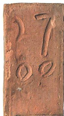
Fig. 5 : Saicourt, Bellelay, L'Abbaye 1. Tomettes avec inscription et dates découvertes scellées dans le sol du couloir, au 1 er étage. Éch. 1:8.