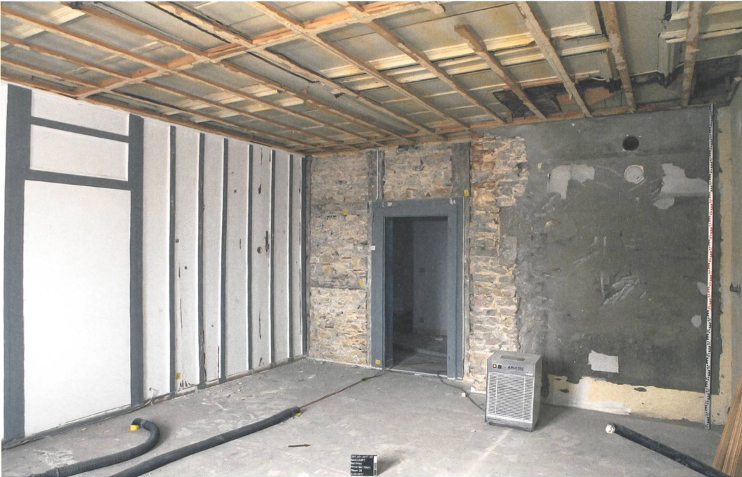
Fig. 7 : Saicourt, Bellelay, L'Abbaye 1. 2 ème étage : la Salle de justice et son plafond à caissons ; à droite, dans le plafond, traces du fourneau rectangulaire aujourd'hui disparu. La paroi en bois, à gauche, est postérieure et date probablement de la seconde moitié du 18 e siècle. Vue vers l'est.