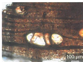
Fig. 3 : Twann-Tüscherz, Uferzone. Coupe transversale d'un échantillon de bois provenant de la poignée du scramasaxe Lnr. 34275 : les cellules du bois sont dégradées et imprégnées par des sels ferreux de couleur orangée.

un objet archéologique humide constitué de parties en fer et en bois représente toutefois un défi, puisque les méthodes de traitement idéales pour chacun des deux composants s'opposent à toutes les étapes du processus.